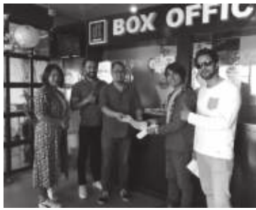
प्रेमगन्ज फिल्मका मुख्य कलाकारहरूले भारतमा फिल्मको प्रदर्शनको अवसरमा एक कार्यक्रममा सहभागिता लिएका छन्।

काठमाडौं/सप्त- नेपाली चलचित्र 'प्रेमगन्ज' भारतमा पनि प्रदर्शन हुने भएको छ। चलचित्र चौतारी र ड्रिम्स थिएटर मोशन पिक्चर बीच भएको सम्झौताअनुसार 'प्रेमगन्ज' पहिलो चरणमा भारतको कोलकाता, देहरादुन, आसाम, गुवाहाटी, अरुणाचल, ब्याङ्गलोर, मुम्बई, दिल्ली, दार्जिलिङ, सिक्किम लगायतका सहरहरूका १०० भन्दा धेरै स्क्रीनमा एकसाथ प्रदर्शन हुने भएको छ। पहिलो चरणको प्रदर्शन सकारात्मक देखिएमा दोश्रो चरणमा भारतका अन्य ठूला सहरहरूमा पनि प्रदर्शन हुनेछ। प्रेमगन्ज नेपाल/भारत दुवै देशमा एउटै मिति भाद्र ३ अर्थात अगस्त १९, मा एकैसाथ प्रदर्शन हुनेछ।