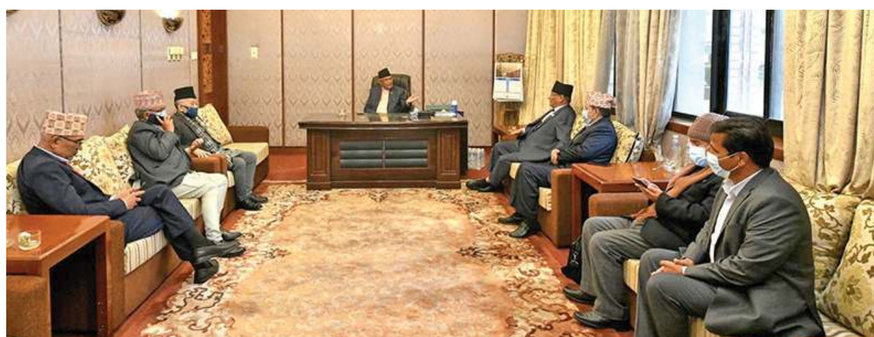
संसद भवन बानेश्वरमा एमाले नेताहरुसँग वार्तामा प्रचण्डसहित माओवादी केन्द्रका नेताहरु ।

सत्ताबाट केपी शर्मा ओलीलाई हटाउन सडकदेखि सदनसम्म लगातार संघर्ष गरेका पुष्पकमल दाहाल प्रचण्डको मूभ फेरिन पुगेको छ । बिहीबार ओलीसँग प्रचण्डले माओवादी केन्द्रका नेताहरुसहित भेटवार्ता गरेका थिए ।