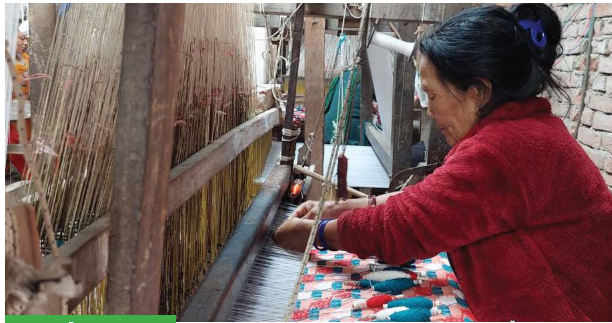
पाल्पाली ढाका उद्योगमा कपडा बुन्दै

पाल्पाली ढाका उद्योगमा कपडा बुन्दै कामदार । पाल्पाली हाल १५ ढाका कारखाना सञ्चालित छन् ।