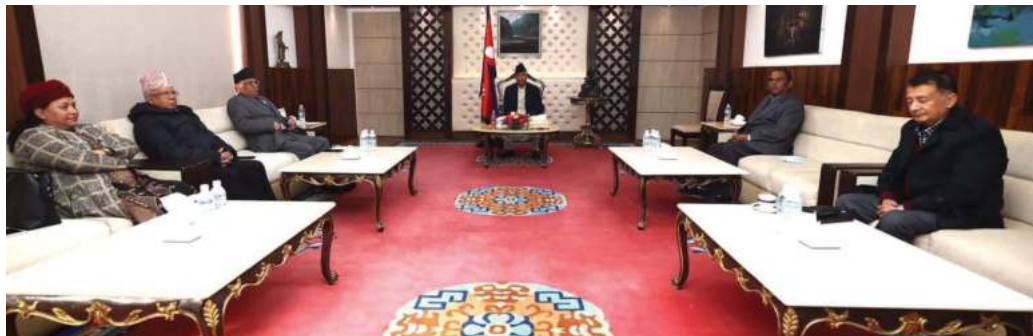
सत्तागठबन्धनका शीर्ष नेताहरुको बैठक प्रधानमन्त्री निवास वालुवाटारमा