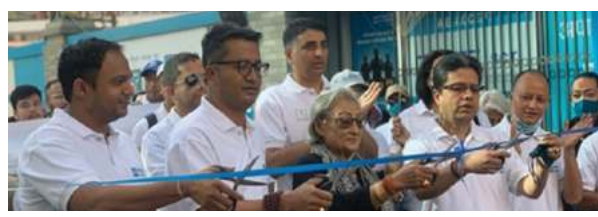
तथा सामाजिक रुपान्तरणको लागि सांस्कृतिक सम्पदा प्रवर्द्धन तथा साक्षरता अभिवृद्धि गर्ने उद्देश्यले उक्त समारोहको आयोजना गरिएको बैंकले जनाएको छ । हेरिटेज सोसाइटीको सहकार्यमा भएको कार्यक्रममा बैंकका

काठमाडौं/स - एनएमबि बैंकले नवौं हेरिटेज वाक कार्यक्रम सम्पन्न गरेको छ । हेरिटेज वाक कोभिड-१९ को प्रकोप पश्चात २ वर्ष पछि आयोजना गरिएको बैंकले जनाएको छ । शनिवार भएको वाक बबरमहलबाट शुरु भई बसन्तपुर डबलीसम्म पुरो समापन गरिएको थियो । समूह नेपालको अपार सम्भावना सहित मुलुकको ऐतिहासिक