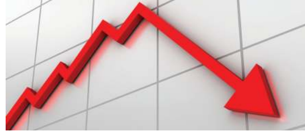
५० दशमलव ९७ मा ओर्लेको छ । नेप्से परिसूचकको ओरालो यात्रासँगै कारोबार रकमसमेत घटेको छ । कूल २ सय ३३ कम्पनीको ३४ लाख सात हजार २ सय ७२ किता सेयर एक अर्ब ४४ करोड सात लाख २३ हजार १ सय ८२ मूल्यमा खरिद विक्री भए । आइतबारको कारोबारपछि बजार पूँजीकरण ३३ खर्ब ८४ अर्ब १२ करोड २८ लाख ६० हजारको हाराहारीमा सीमित भएको छ । नेप्सेका अनुसार कारोबार

काठमाडौं/रासस - धितोपत्र बजारमा आज सेयर कारोबार मापक नेप्से परिसूचक झन्डै ३० अंकले ओरालो लागेको छ । नयाँ वर्षको पहिलो कारोबार सकारात्मक हुने अनुमान विपरीत आज नेप्से परिसूचकमा गिरावट देखिएको हो । नेपाल स्टक एक्सचेन्जका अनुसार नेप्से परिसूचक २९ दशमलव ६० अंकले ओरालो लागेर दुई हजार ३ सय ८५ दशमलव ६४ मा ओर्लिएको हो । यस्तै, टुला कम्पनीको सेयर कारोबार मापन गर्ने सेन्सिटीभ परिसूचक ५ दशमलव १२ अंकले ओरालो लागेर ४ सय