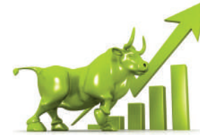
नेप्सेका अनुसार कारोवार भएका १३ उपसमूहको सेयर

मूल्यमा वृद्धि भएको छ । बैंकिङ ६.५६, व्यापार ३२.४७, होटल तथा पर्यटन २७.४१, विकास बैंक ४१.५८, जलविद्युत् १५.९५, वित्त ४४.२, निर्जीवन बीमा ७२.६, उत्पादन ६४.१९, अन्य ३.१८, लघुवित्त ८१.६२, जीवन बीमा ८०.०१ र लगानी ०.३५ अंकले उकालो लागेको छ । मंगलवारको कारोवारपछि बजार पुँजीकरण २९ खर्ब २१ अर्ब ३५ करोड ३४ लाख ९५ हजार ४६२ वरावर रहेको छ ।