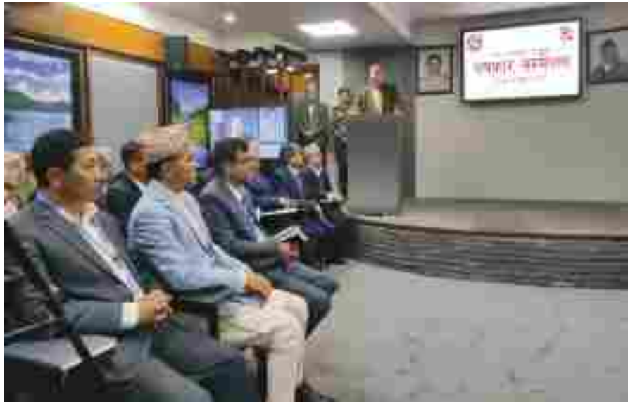
मध्यान्ह संवाददाता काठमाडौं, २२ फागुन

सरकारले मास्कको अर्पित र उत्पादन बढाउने विषयमा पहल थालेको छ। यस विषयमा निजी क्षेत्रसँग सहकार्य भइरहेको सरकारले जनाएको छ। नेपालमा कोरोना भाइरस (कोभिड-१९) को प्रभाव नदेखिएको बताउँदै सरकारले संक्रमण हुने नदिने गरी उच्च सुरक्षा सतर्कता अपनाइएको बताएको छ।