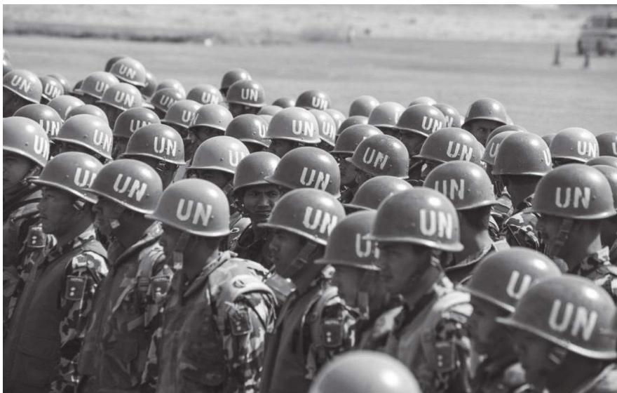
मिलाइएको जनाइएको छ।

विश्वव्यापीरूपमा फैलिइरहेको कोभिड-१९ को सङ्क्रमणबाट जोगिन शान्ति मिसनमा तैनाथ नेपाली सेनाद्वारा सचेतना कार्यक्रम र सङ्ग्रामबाट खतरामुक्त रहेको यकिन गर्न आवश्यक प्रबन्ध