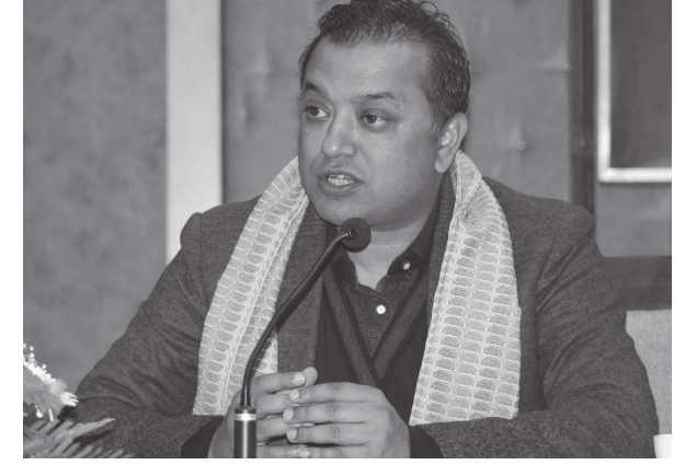
सरकारसँग माग गरेका छन्।

काठमाडौं / मस- प्रमुख प्रतिपक्षी दल नेपाली कांग्रेसका सांसद गगन थापालाई सबै अस्पतालमा फिबर क्लिनिक खोल्न सरकारको ध्यानाकर्षण गराएका छन्। बुधवार कोभिड-१९ रोकथाम तथा नियन्त्रण उच्चस्तरीय समितिका संयोजक उपप्रधानमन्त्री ईश्वर पोखरेललाई ध्यानाकर्षण पत्र बुझाउँदै थापाले कोरोनाको शंका लागेर आउने व्यक्तिलाई अरु विरामीभन्दा अलग रूपमा दर्ता, परीक्षण र उपचार गर्न हरेक अस्पतालमा फिबर क्लिनिक स्थापित गर्न माग गरेका हुन्।