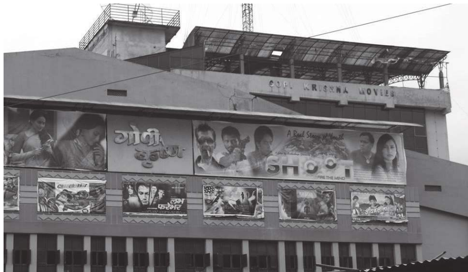
मध्याह्न संवाददाता काठमाडौं ६ चैत्र

सरकारले आउँदो वैशाख १८ गतेसम्मलाई सम्पूर्ण सिनेमा हलहरू बन्द गर्ने निर्णय गरेको छ। उपप्रधान एवं रक्षामन्त्री ईश्वर पोखरेलको नेतृत्वमा रहेको कोरोना भाइरस (कोभिड-१९) रोकथाम तथा नियन्त्रण उच्च स्तरीय समन्वय समितिले बुधवार वैशाख १८ सम्मलाई सिनेमा हल, सांस्कृतिक केन्द्रहरू, रंगशाला, जिम, हेल्थ क्लब, म्युजियम लगायतका मनोरञ्जन स्थल बन्द गर्ने निर्णय गरेको हो।