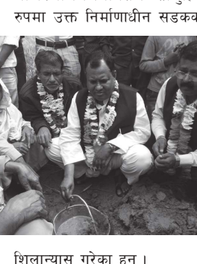
शिलान्यास गरेका हुन्।

मोजरेआलमलगायतले सामुहिक रूपमा उक्त निर्माणाधीन सडकको