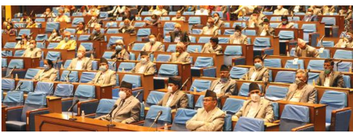
दिवाकर अधिकारी/मध्यान्ह काठमाडौं, २५ वैशाख । जेठ ३ गतेका लागि संघीय संसदको अधिवेशन आह्वान भएको छ । तर, प्रमुख

विपक्षी नेकपा एमालेले संघीय संसदमा जारी राखेको अवरोध नहटाउने भएको छ । यो अधिवेशनको मुख्य काम बजेट पारित गर्नु हो । बाँकी पृष्ठ २ मा