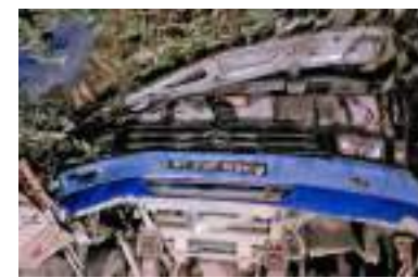
दुर्घटनामा परेको बस ।