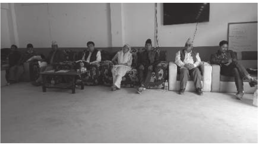
कमल खड्का / मध्यान्ह रोल्पा, २८ जेठ

रोल्पाको रुन्टीगढी गाउँपालिकाले आर्थिक वर्ष २०७९/०८० को नीति तथा कार्यक्रम प्रस्तुत गरेको छ । गाउँपालिकाको सभाहलमा भएको कार्यक्रम २० वूँदे नीति तथा कार्ययोजना प्रस्तुत गरिएको छ ।