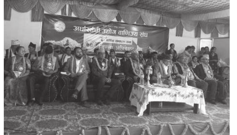
शोभाखर पन्थी अर्घाखाँची, २८ जेठ

उद्योगी व्यवसायीका समस्याप्रति राज्य उदासीन भएको भन्दै एक कार्यक्रमका सहभागीहरूले सरकारको ध्यानाकर्षण गराएका छन् ।