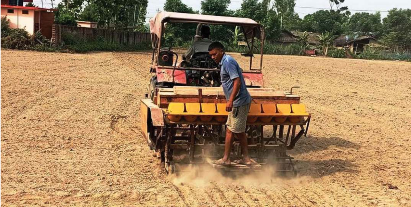
काठमाडौं, २९ जेठ । कञ्चपुरको बेलौरी नगरपालिकाको कलकताका किसान छरुवा (डिपसआर) प्रविधिबाट खेतमा जोसिनको सहायताले धान छर्दै ।