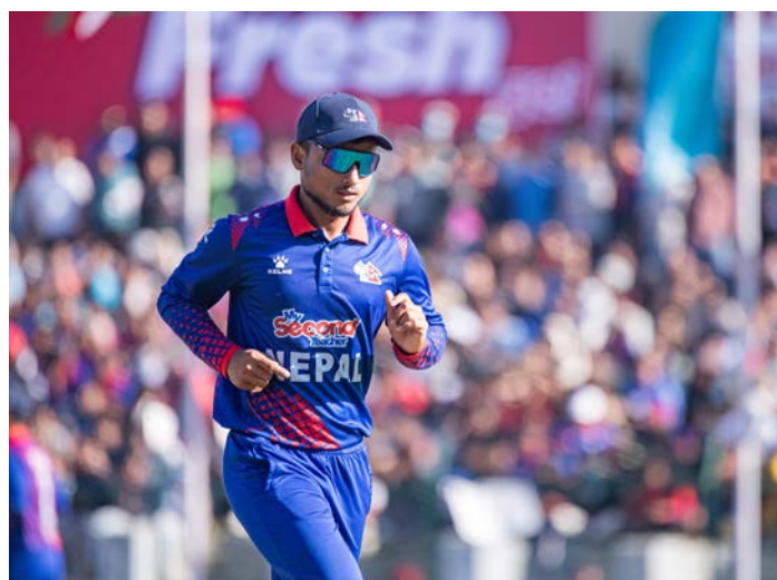
रहने क्यानले जनाएको छ। कात्तिक १६ देखि १८ सम्म चल्ने प्रतियोगितामा नेपालको पहिलो खेलमा इन्ड्यान्डसंग कात्तिक १६ गते रहेको छ। नेपालले दोस्रो