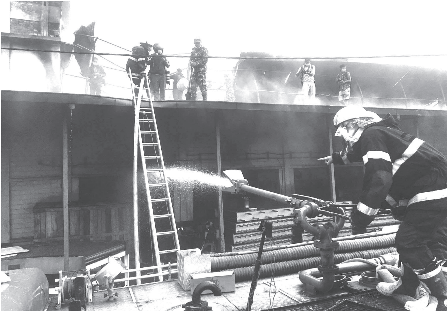
काठमाडौंको बालाजु औद्योगिक क्षेत्रभित्र रहेको नेविको प्रालिमा लागेको आगो नियन्त्रणमा लिँदै सुरक्षाकर्मीलगायत ।