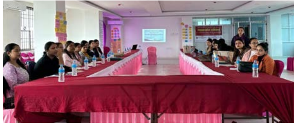
तेज बन् मध्यान्ह इटहरी, २८ मंसिर

इटहरी उपमहानगरले आफ्नो क्षेत्रमा रहेका सबै सामुदायिक विद्यालयहरूमा एक विद्यालय एक नर्स कार्यक्रम सुरु गरेको छ।