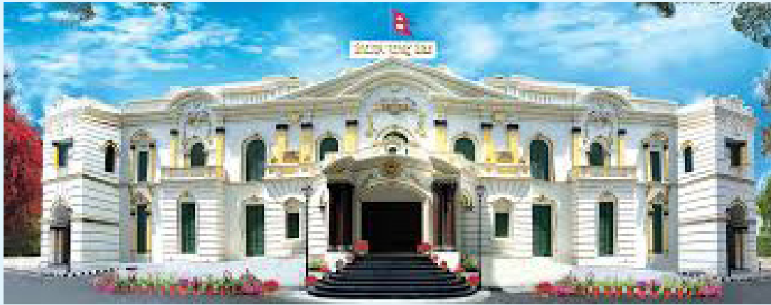
नारायण अर्याल/मध्यान्ह काठमाडौं, २७ मंसिर ।

नेपालको अर्थतन्त्रको बाध्य अवस्थामा थप सुधार हुँदै गएको देखिएको छ। नेपाल राष्ट्र बैंकले विहीवार सार्वजनिक गरेको प्रतिवेदनले अर्थतन्त्रको बाध्य अवस्थामा विगतको तुलनामा थप सुधार भएको देखाएको हो। प्रतिवेदनले चालु आर्थिक वर्षको कात्तिक मसान्तसम्म नेपालमा २२ खर्ब ५५ अर्ब ३५ करोड रूपैयाँ विदेशी