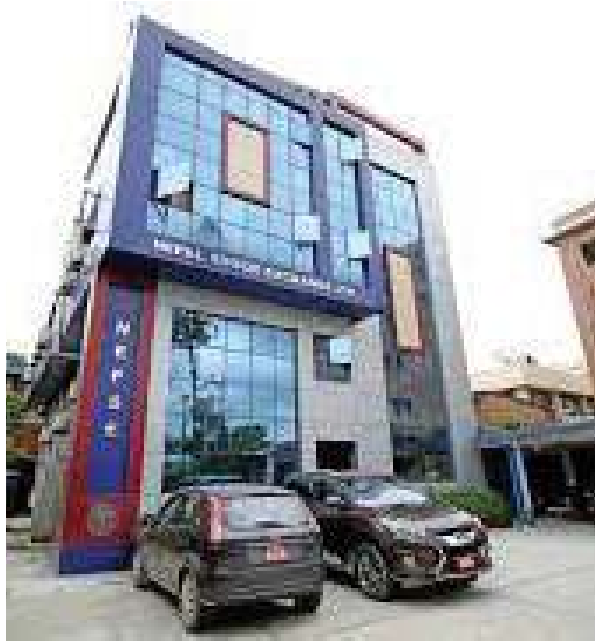
यसदिन विकास बैंक, फाइनेन्स, जलविद्युत, लगानी,

बजार पूँजीकरण पनि ३८ खर्ब ९४ अर्ब ९२ करोड ६५ लाख ८५ हजार ९ सय ५८ रुपैयाँ कायम भएको छ । साधारण शेयर तर्फको बजार पूँजीकरण पनि १३ खर्ब ७७ अर्ब ६ करोड १४ लाख ५ हजार ४ सय ६ रुपैयाँ कायम भएको छ ।