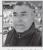
पुष्प खिमिरे काँडा, सिककिम

५. सार्किएन फालन ती सब,जे थिए फाल्नुपर्ने । बाँकी रहे वैधित्यका,पर्खालहरू डाल्नुपर्ने । बसाउनेले यो संसारमा कस्तो धीति बसाएछन्, आफ्नो मुटु चुँडालेर,अर्कोको मन टाल्नुपर्ने ?