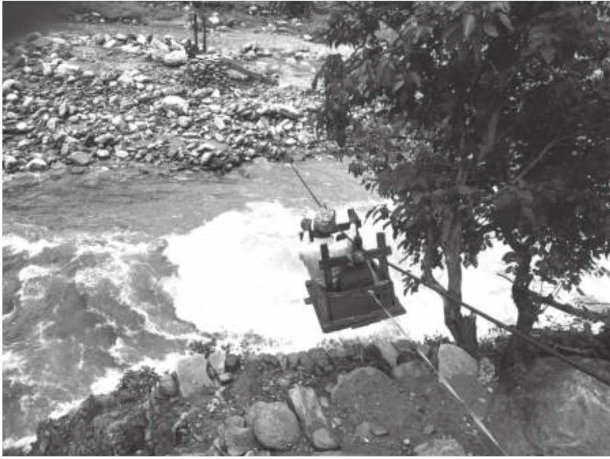
जाजरकोटको जुनिचिँदै गाडापालिका-४ र छेडागाड नगरपालिका- ६ बीचमा रहेको मजकोट खोला मा तुइनमार्फत कक्षा ११ को परीक्षामा सहभागी हुन जाँदै विद्यार्थी । प्रतिव्यक्ति रु १०० तिरेर जानु परेको विद्यार्थीले बताएका छन् ।