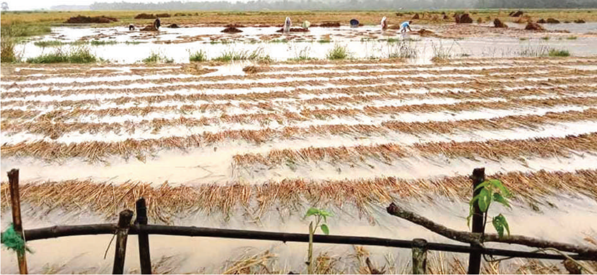
अधिरल वर्षाका कारण किसानले काटेर राखेको धानबाली पानीले बगाउन थालेपछि दाङ शान्तीनगर गाउँपालिका-३ देबीपुरका किसान धान स्याहाउँदै ।

हिउँद शुरु भइसक्दा लगातार भइरहेको वर्षाका कारण देशभरको जनजीवन नराम्रोसँगै प्रभावित बनेको छ । बाढी, पहिरो र डुवानमा परेकाहरुको उद्धार प्रयास जारी छ ।