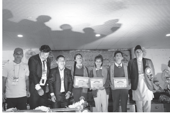
बत्त्वकला प्रतियोगितामा मल्ल बिजयी

प्रवासी म्याग्देलीहरूको साप्ताहिक सामाजिक संस्था म्याग्दी प्रवासी नेपाली संघ मोना अन्तर्राष्ट्रिय कार्यकारी समितिको चौथो महाधिवेशन सदरमुकाम बेनीमा जारी रहेको छ। बुधबार सम्पन्न हुने महाधिवेशनको पहिलो दिन मंगलबार जल्लामा बसोबास गर्ने विभिन्न जातजातिको पहिचान भन्दा नभन्दा भौतिकसहितको स्थानीय बजार परिक्रमा गरेर जिल्ला समन्वय समितिको सभा हलमा पुगेर औपचारिक कार्यक्रम सुरु भएको थियो।