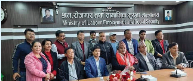
वैदेशिक रोजगार विशेष