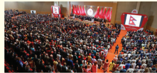
१५-१७ असोजमा सकिएको नेकपा एमालेको विधान महाधिवेशनका सहभागी ।

प्रमुख राजनीतिक दलहरूले आन्तरिक समस्या समाधान गर्न नसक्दा निर्धारित महाधिवेशन/राष्ट्रिय सम्मेलन पटकपटक सर्दै आएका छन् ।