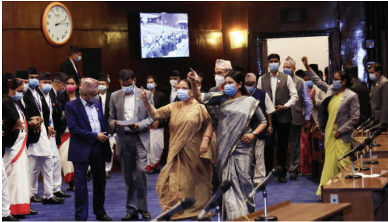
प्रतिनिधिसभा बैठक अवरोध गर्दै विपक्षी दल नेकपा एमालेका सांसदहरू । फाइल तस्वीर

संघीय संसद राजनीतिक जातिरोधले बन्धक हुँदा ५० विधेयक अलपत्र छ । कानूनविद्हरू संसद हुँदाहुँदै विधेयक अलपत्र पर्नुले लोकतान्त्रिक प्रणाली माथि नै प्रश्न उठ्ने बताउँछन् ।