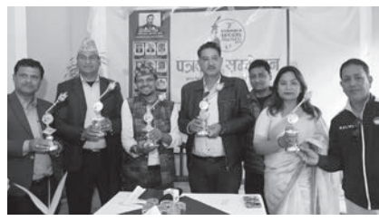
खेलाडीले टेलिज नेपालको टाइगर इलेक्ट्रिक स्कुटर र टुफ्री हात पार्नेछन्।

पोखरा/मस- सातौँ संस्करणको पोखरा स्पोर्ट्स अवार्डको टुफ्री सार्वजनिक गरिएको छ। आयोजक नेपाल खेलकुद पत्रकार मञ्च गण्डकीले विहीवार पोखरामा पत्रकार सम्मेलन कार्यक्रमको आयोजना गरी टुफ्री सार्वजनिक गरेको हो।