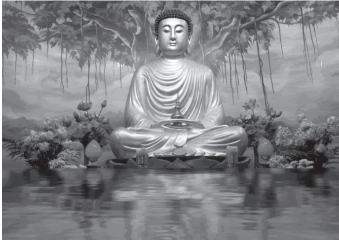
'अहिंसा नै शान्ति र मैत्रीको आधारशिला हो', यस्ता अनेकौं कालजयी सन्देशका वाहक भगवान् गौतम बुद्धको

बुद्धको जन्म, ज्ञान प्राप्ति, महापरिनिर्वाण (मृत्यु) वैशाख शुक्ल पूर्णिमाकै तिथिमा परेकाले यस दिन नेपाललगायत विश्वका बौद्ध धर्मावलम्बीले बुद्धप्रति भावपूर्ण श्रद्धा र भक्तिले बुद्ध जयन्ती मनाउने गर्दछन्।