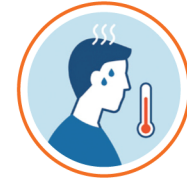
ज्वरो (१००.४° F भन्दा माथि)

नोबेल कोरोना भाइरस (Conid-19) का मुख्य लक्षणहरू