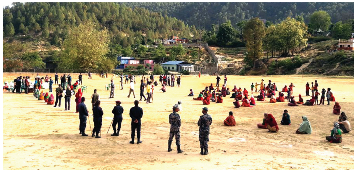
डोटीको दिपायल सिलगढी नगरपालिकाले नगरभित्र रहेका विपन्न तथा आर्थिक अवस्था कमजोर भएकालाई राहत वितरण शुरू गरेपछि दिपायलस्थित राजपुरमा राहत लिन आएका सर्वसाधारण ।

गएको चैत ११ गतेदेखि महामारी रोकथामका लागि देशब्यापी लकडाउन जारी गरिएको छ । लकडाउनकै अवधिमा उदयपुरमा संक्रमित संख्या बढ्दै गएको छ । उदयपुरको संक्रमणलाई स्वास्थ्यकर्मीहरूले तेस्रो चरणको संक्रमण भएको जनाएका छन् । यसलाई खतराका रूपमा लिइन्छ ।