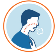
श्वासप्रश्वासमा अत्याधिक समस्या