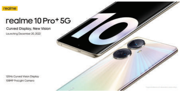
एक करोड खर्च गरिएको कम्पनीले जनाएको छ।

काठमाडौं/मस - स्मार्टफोन ब्रान्ड रियलमीले मिड रेन्जको प्रिमियम स्मार्टफोन नेपालमा ल्याउने भएको छ। यो नेपालमा आउन लागेको रियलमी १० प्रो सिरिजकै पहिलो फोन भएको जनाइएको छ। रियलमी १० प्लस प्रो ५जी नाम दिइएको यो स्मार्ट फोनको कम्पे डिस्प्ले आकर्षक र स्टाइलिश देखिन्छ। डिस्प्ले टेक्नोलोजी सुधान मात्र लगभग साडे