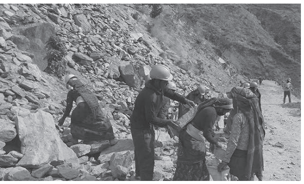
कालोपत्रे गरिसके गरी पूर्वाधार विकास कार्यालय र निर्माण कम्पनी केएस शनिदेव जैमवीच सम्झौता भएको थियो। तर अहिलेसम्म काम

मान बहादुर विश्वकर्मा / मध्याह्न कालीकोट, २८ मंसिर जिल्लामै पहिलो पटक कालोपत्रे हुन लागेको शान्तिघाट-रास्कोट सडक कालोपत्रेको काम शुरु हुन सकेको छैन। रास्कोट नगरपालिका-६ शान्तिघाटदेखि आरसिपी वजारसम्मको ११ किलोमिटर सडक पहिलो पटक कालोपत्रे हुने भएपछि स्थानीय बुशी भएका थिए। निर्माण शिलान्यास गरिएको एक वर्ष बित्दासमेत निर्माण शुरु नहुँदा नागरिकहरूमा निराशा छाएको छ। २०७९ पुसभित्र