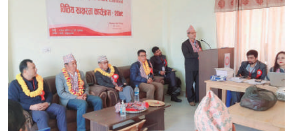
करिब ७० जनाको उपस्थिति रहेको थियो।

काठमाडौं/मस - हिमालयन बैंक लिमिटेडले संस्थागत सामाजिक उत्तरदायित्व अन्तर्गत मादी नगरपालिकामा मिति २०७९ साल मंसिर २२ गते शुक्रबार र पाँचवाँस नगरपालिकामा वित्तीय साक्षरता कार्यक्रम सम्पन्न गरेको छ। बैंकले २४ गते शनिवार सो कार्यक्रम सम्पन्न गरेको जनाएको छ। कार्यक्रमको आयोजना बैंकको विराटनगर स्थित प्रदेश १ कार्यालय, मादी शाखा तथा हिले शाखाले संयुक्त रुपमा आयोजना गरेको जनाइएको छ।