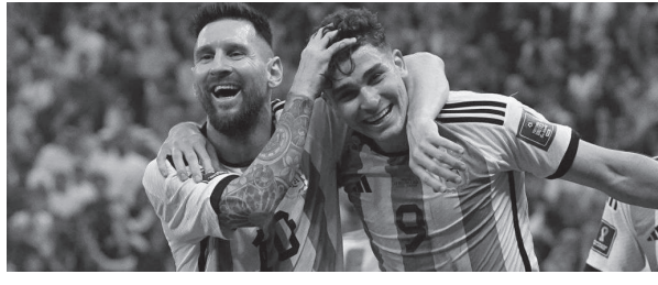
लियोनल मेस्सी/ मध्याह्न दोहा, कतार, २८ मंसिर

पहिलो हाफमा २-० गोलको अग्रता दिलाए। काउन्टर बलमा क्रोएसियाका डिफेन्डरले बल क्लियर गर्न नसक्दा अल्भारेजले एकल प्रयासमा गोल गरे। खेलको ६९ औं मिनेटमा मेस्सीले उपलब्ध गराएको सुन्दर पासमा अल्भारेजले व्यक्तिगत दोस्रो गोल गर्दै अर्जेन्टिनालाई ३-० गोलको सहज जित दिलाए। दुई