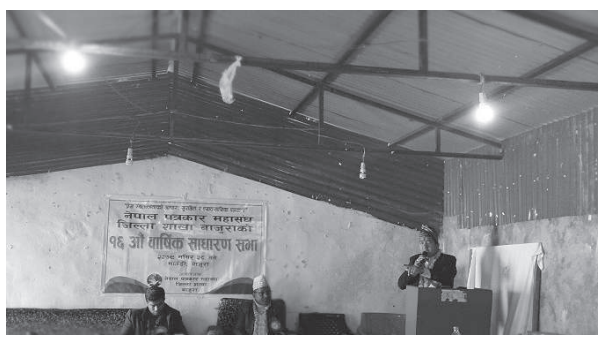
वेजुरा पाध्याय/मध्याह्न बाजुरा, २८ मंसिर

नेपाल पत्रकार महासंघ जिल्ला शाखा बाजुराले आफ्नो १६ औँ स्थापना दिवस मनाएको छ। १६ औँ वर्षमा प्रवेश गरेको उपलक्ष्यमा महासंघ बाजुराले आफ्नो स्थापना दिवस बनाएको हो। नेपाल पत्रकार महासंघ बाजुरा शाखाले हालसम्म १६ औँ वार्षिक साधारणा सभामा उल्लेख गरेको छ।