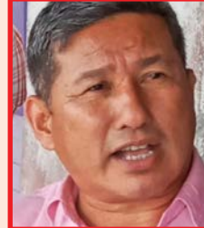
विस्तार गर्ने कार्यदलको अध्यक्ष रहेका छन् ।