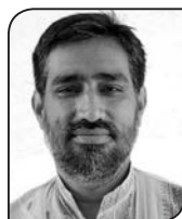
● धर्मन्द्र भा

स्वतन्त्र पत्रकारिता लोकतन्त्रको पहिलो आवश्यकता र शर्त दुवै हो । यसको अभावमा लोकतन्त्र छ भनेर कहिँ दावी गरिन्छ भने त्यो फगत दावीमात्र हुनेछ । यस परिदृश्यमा लोकतन्त्रको यो महत्वपूर्ण औजारलाई जोगाडरहने अभिभारा स्वभावले सञ्चारकर्मीको काँधमा जान्छ । यस्तोमा पत्रकार बलियो नभई पत्रकारिता र लोकतन्त्र बलियो हुन नसक्ने यथार्थ हामी सबैले बुझ्नु जरुरी छ । पत्रकारिता स्वतन्त्र, बलियो र प्रभावकारी नहुँदा लोकतन्त्र पनि सुदृढ हुन सक्दैन । लोकतन्त्रको सुदृढीकरणको अभावमा जनताको मौलिक अधिकार पनि सुरक्षित नहुने निश्चित छ ।