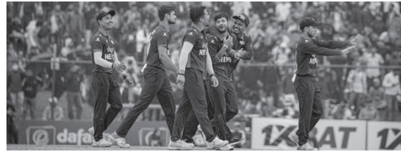
बंगलादेश, श्रीलंका र अफगानिस्तान छन्। हरेक समूहको शीर्ष दुई टोलीले सुपर फोरमा स्थान बनाउनेछन्। सुपर फोरबाट शीर्ष दुई टोली फाइनल खेल्नेछन्। यसैबीच नेपाल प्रहरीले नेपाल प्रहरीबाट राष्ट्रिय क्रिकेट टिमको प्रतिनिधित्व गर्दै अन्तर्राष्ट्रिय क्रिकेट प्रतियोगितामा उत्कृष्ट खेल प्रदर्शन गर्ने खेलाडीलाई सम्मान गरेको छ।

एसिया कप २०२३ आगामी सेप्टेम्बरमा पाकिस्तानमा हुनेछ। नेपाल, भारत र पाकिस्तान एकै समूह ए मा छन्। समूह बी मा