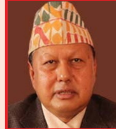
नवनियुक्त मन्त्रीहरूको विहीवार दिउँसो ३ बजे शपथ ग्रहण हुनेछ । ३ जना मन्त्री नियुक्तिसँगै मन्त्रिपरिषद्