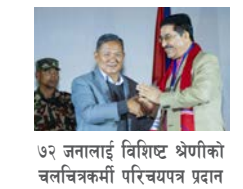
७२ जनालाई विशिष्ट श्रेणीको चलचित्रकर्मी परिचयपत्र प्रदान