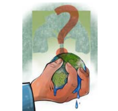
संकटमा जैविक विविधता