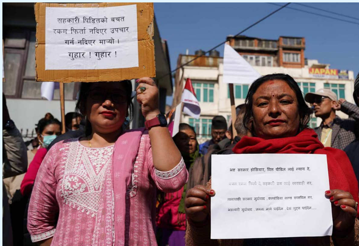
न्याय दे ! : सहकारीपीडितहरू बुधवार माइतीघरमा प्रदर्शन गर्दै ।

प्राधिकरणले हालसम्म प्रतिस्पर्धी बजार र मध्यकालीन विद्युत् विक्री सम्झौता बमोजिम २८ वटा आयोजनाहरूबाट उत्पादित ९४१ मेगावाट विद्युत् भारतीय बजारमा विक्री गर्न स्वीकृत पाएको छ। प्राधिकरणले गत आर्थिक वर्षमा भारतबाट १६ अर्ब ९३ करोड रुपैयाँको विद्युत् आयात गरेको थियो।