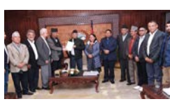
इजरायल-प्यालेस्टाइन युद्धमा तटस्थ नबस्न ध्यानाकर्षण