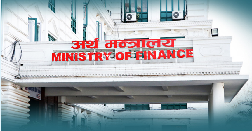
मध्याह्न संवाददाता काठमाडौं, ११ पुस ।

विकास आयोजनाका लागि सात अर्ब ६४ करोड निकास