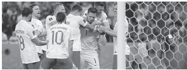
तिलु शर्मा पौडेल/मध्याह्न दोहा, कतार, १० मंसिर

कतारमा जारी फिफा विश्वकप फुटबल अन्तर्गत अस्ट्रेलियाले पहिलो जित हात पारेको छ । अल जानोव स्टेडियममा भएको समूह 'डी' को खेलमा अस्ट्रेलियाले दार्जिनसियालाई १-० गोल अन्तरले पराजित गर्दै पहिलो जित हात पारेको हो ।