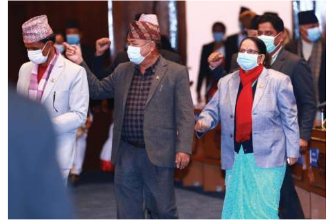
मुकुन्द लामिछाने/मध्यान्ह काठमाडौं, ६ पुस ।

नेकपा एकीकृत समाजवादीका १४ सांसदलाई संसदबाट हटाउन माग गर्दै संघीय संसद अवरोध गरिरहेको नेकपा एमालेले मंगलबार पनि बैठक चल्न दिएन । गएको मंसिर २८ गतेबाट विधेयक अधिवेशन शुरू भएको छ । पहिलो दिन संसद अवरोध गरेको एमालेले मंगलबार पनि बैठक चल्न दिएन ।