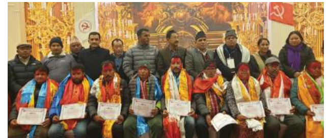
मध्यान्ह संवाददाता काठमाडौं, ६ पुस ।

सत्ता साभेदार दल नेकपा माओवादी केन्द्रको बागमती प्रदेश नेतृत्व मतदानबाट टुंगिएको छ । पहिलो पटक माओवादी केन्द्रले लोकतान्त्रिक प्रक्रियाबाट नेतृत्व चयन गरेको हो । त्यसअघि माओवादीको नेतृत्व चयनका निमित्त मतदानको अभ्यास भएको थिएन । विराट सम्मेलनबाट प्रमुख नेतृत्वमा केन्द्रीय सदस्यहरूले मतदान गरेका थिए ।