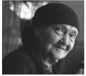
जेष्ठ नागरिक घोषित भएका थिए । निधन हुनु अगाडिसम्म