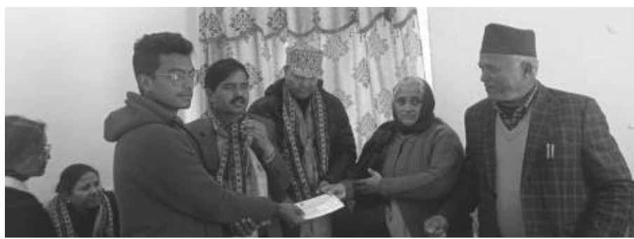
प्रभावितहरूले बताएका छन्। प्रभावितहरूलाई अस्थायी आवास १७ र मेलम्चीका ५ परिवारलाई इन्द्रेणीले मेलम्ची नगरपालिका निर्माणका लागि रकम सहयोग इन्द्रेणीले घर निर्माणको लागि रकम सहयोग गरेको थियो।

घरको अवलोकन गर्दै कंडेलले थप पाँच घर निर्माणका लागि ३ लाखका दरले १५ लाख हस्तान्तरण गरेका हुन्। बाँकि रकम ३ लाख ३५ हजार रुपैयाँ घर बनाइसकेपछि दिइने कंडेलले जानकारी दिए। इन्द्रेणीको सहायतामा अहिले अस्थायी आवास बनाएकाहरु भने खुशी भएका छन्। प्राप्त रकम र आफूसँग भएको रकमले तत्कालका लागि अस्थायी आवास निर्माण गरिएको