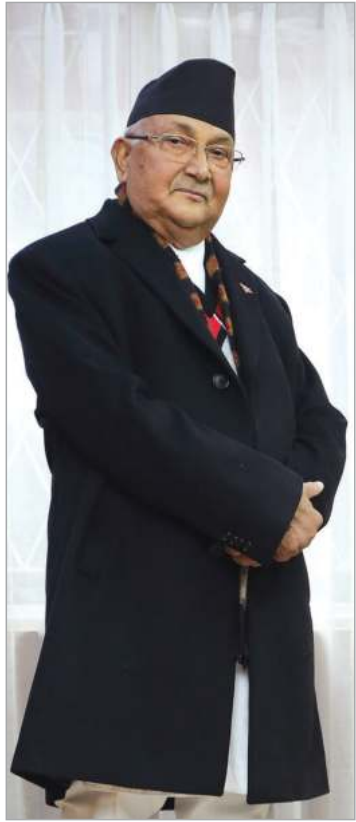
दिवाकर अधिकारी/मध्यान्ह काठमाडौं, ६ पुस ।

आगामी वर्ष तीनै तहको निर्वाचन हुँदैछ । २०७८ को निर्वाचन भएको चार वर्ष पार भइसकेको छ । यो अवस्थामा नेताहरूले भने एकाएक दक्षिणपन्थी शक्तिलाई चुनौती दिइरहेका छन्, तर त्यो शक्ति राप्रपा हो वा अरु कुनै ?