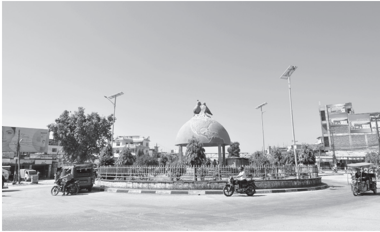
को को छन् त आकांक्षी ?

नेकपा एमालेका अध्यक्ष केपी शर्मा ओलीको गृहनगर दमकमा एमालेलाई घेराबन्दीमा पार्ने रणनीतिमा अन्य दल रहेका छन्। सत्ता गठबन्धनले दमकमात्र आफ्नो पक्षमा पार्न सके ठूलै उपलब्धी हुने प्रतिक्रिया दिइरहेका छन्। निर्णायक शक्तिको रूपमा रहेको राष्ट्रपाले दमकलाई केन्द्रमा राखेर राजनीतिक कार्यक्रम गर्दैछ।