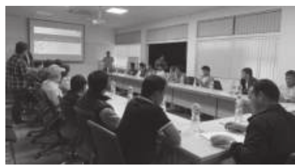
क्षेत्रमा गरेको प्रतिबद्धता र पहलबारे जागरुकता सिर्जना

काठमाडौं/मस - नेपालको लागि हुण्डाइको आधिकारिक विक्रेता लक्ष्मी इन्टरकन्टिनेन्टल प्रा.लि. द्वारा चैत २५ गते थापाथलीमा रहेको हुण्डाइको अत्याधुनिक विद्युतीय सौरुसमा मिडिया भेला सम्पन्न गरेको छ। सो अवसरमा डेडिकेटेड सौरुस, विगो संचालन र विद्युतीय गाडीको पुर्जाहरूको बारेमा जानकारी गराइएको थियो। उक्त अवसरमा सोही सौरुसबाट पाटनको औद्योगिक क्षेत्रमा रहेको हुण्डाइ तालिम केन्द्रमा लगी विभिन्न प्रस्तुतीमाफत हुण्डाइ विद्युतीय गाडीको पुर्वाधार र संचालन सम्बन्धी विभिन्न जानकारी गराइएको थियो।