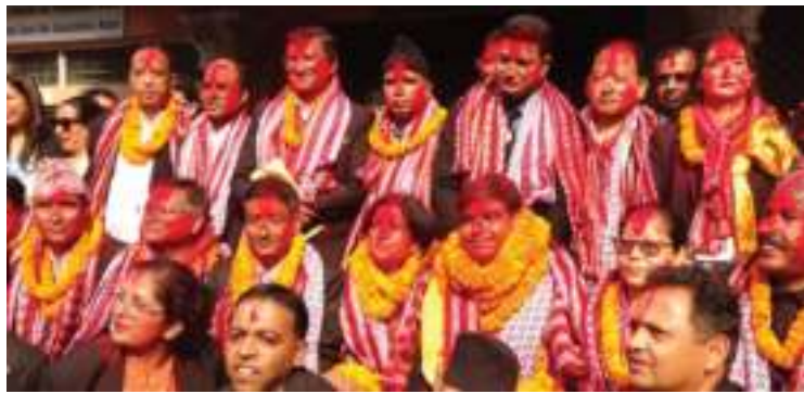
नेपाल बार एसोसिएसनको नवनिर्वाचित कार्यसमितिलाई