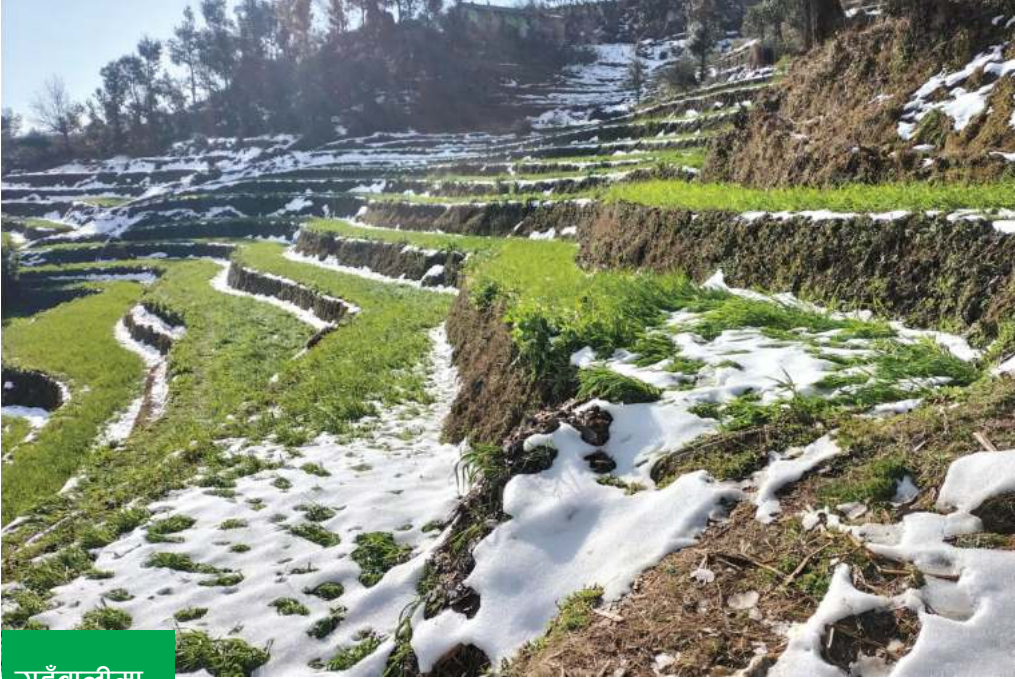
गाहुँबालीमा सेताठमे हिउँ बैँडीको पाटन नगरपालिका-४ स्थित पिल्लोपालीमा किसानले लगाएको गाहुँबालीमा परेको हिउँ ।