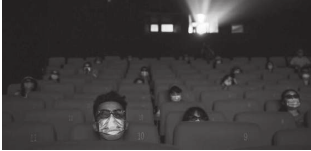
मध्याह्न संवाददाता काठमाडौं, २४ माघ

फागुन १ गतेदेखि सिनेमा हल सञ्चालन गर्न पाइने भएको छ। आइतबार बसेको प्रमुख जिल्ला अधिकारीहरूको बैठकले सिनेमा हल, जिम खाना, डान्सबार, दोहोरी साँभसहित रात्रिकालीन व्यवसाय खोल्न दिने निर्णय गरेको हो। तर, राति १० बजेपछि भने यस्ता व्यवसाय सञ्चालन गर्न नपाइने प्रशासनले जनाएको छ। व्यवसाय सञ्चालन गर्दा