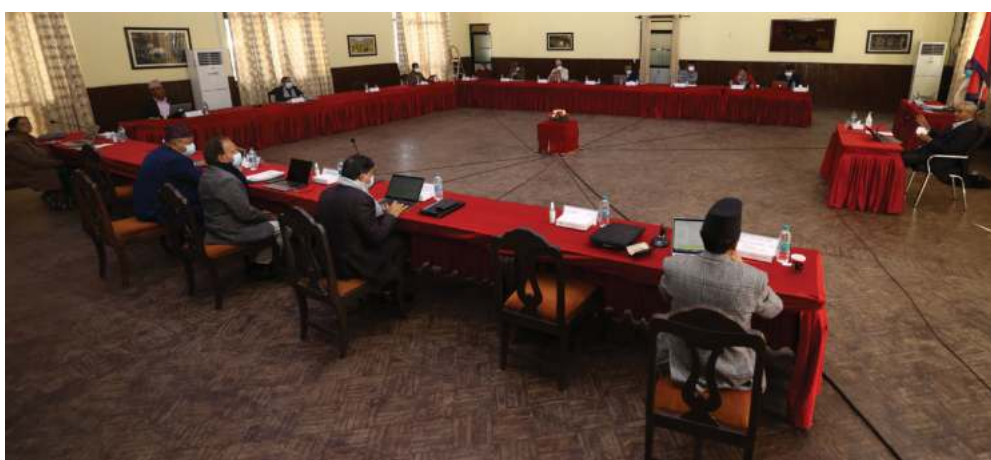
प्रधानमन्त्री निवास बालुवाटारमा सोमबार बसेको मन्त्रिपरिषदको बैठकमा सहभागी प्रधानमन्त्री शेरबहादुर देउवा र मन्त्रीगण ।