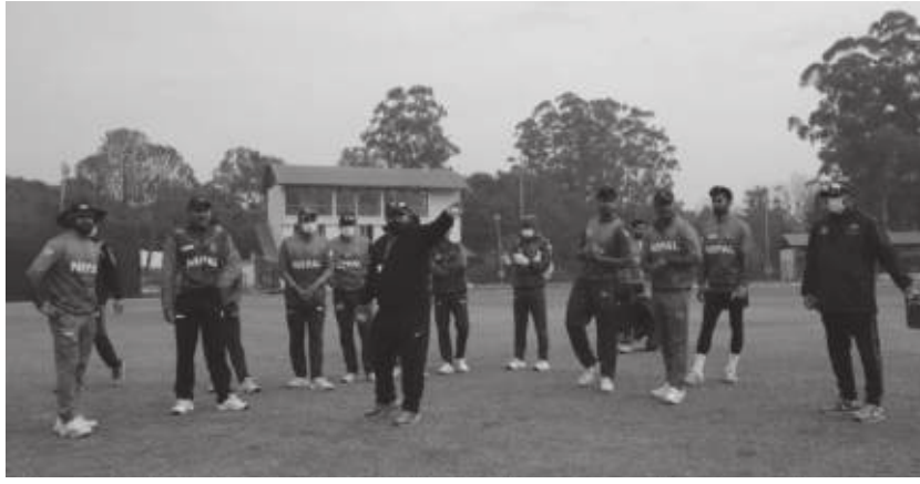
मध्याह्न संवाददाता काठमाडौं, २४ माघ

नेपाली राष्ट्रिय क्रिकेट टिम मंगलबार ओमान जाँदै छ । ओमानमा हुने चारदेशीय टी २० क्रिकेट सिरिज र त्यसपछि हुने विश्वकपको ग्लोबल छनोटका लागि नेपाली क्रिकेट टिम मंगलबार ओमान जान लागेको हो ।