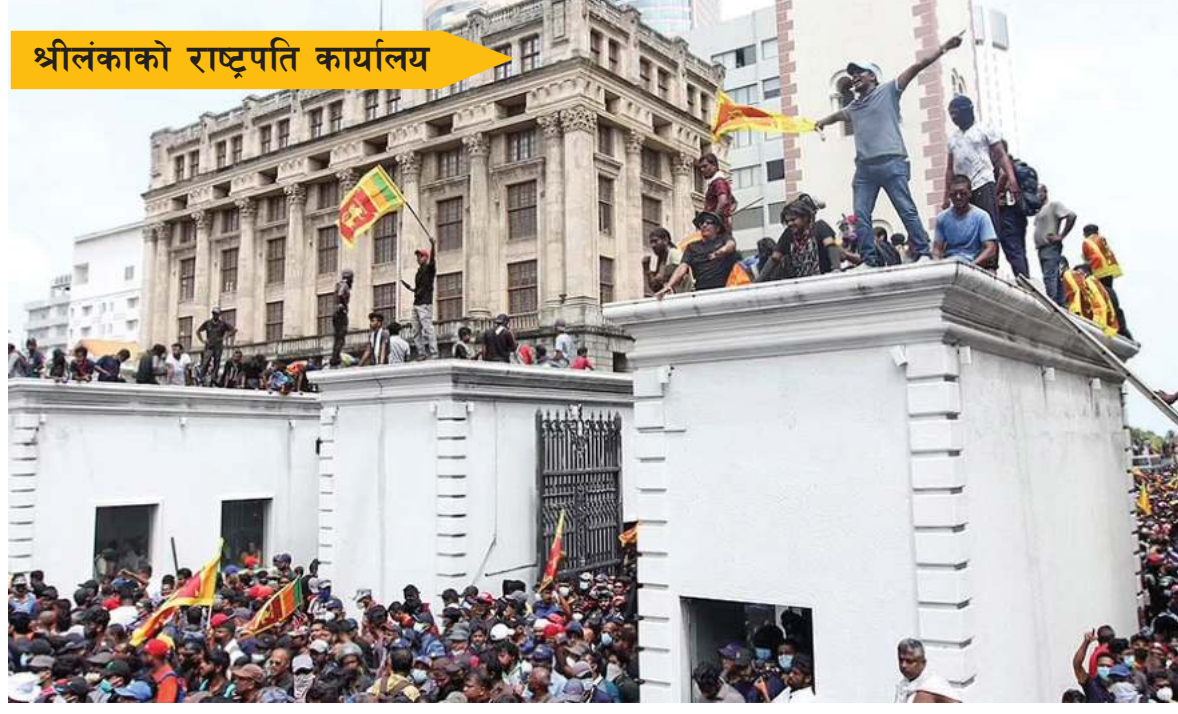
श्रीलंकाको राष्ट्रपति कार्यालय