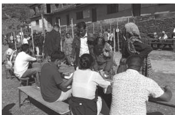
देवराज पाध्याय/मध्यान्ह बाजुरा, २५ असार

बाजुराको बुढीगंगा नगरपालिकाको ६ वटा वडाको अन्तिम मत परिणाम सार्वजनिक भएको छ।