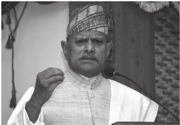
भइरहेको चुरे दोहन र चुरेको विनास भएको उनको भनाइ थियो ।

जनकपुरधाम/मस- पूर्वराष्ट्रपति डा. रामवरण यादवले चुरे क्षेत्रको संरक्षणमा सरकारले ध्यान नदिएकोप्रति दुःख व्यक्त गरेका छन् । जनकपुरधाममा भएको 'मधेस मन्थन' कार्यक्रममा पूर्वराष्ट्रपति डा. यादवले अनधिकृत रूपमा भइरहेको चुरे दोहनका कारण तराई मधेस क्षेत्र मरुभूमि बन्ने अवस्थामा पुग्ने लादासमेत सरकारले चुरे क्षेत्रको संरक्षणमा सरकारको ध्यान पुग्न नसकेकोप्रति दुःख व्यक्त गरे । 'पहिला तराई क्षेत्र तराई थियो, यहाँ पर्याप्त पानी हुन्थ्यो, धान, गहुँ पर्याप्त मात्रामा उत्पादन हुन्थ्यो', पूर्वराष्ट्रपति डा. यादवले भने, 'तर अहिले तराई मधेसमा पानीको समस्या देखिएको छ, खाद्यान्न बाहिरबाट आयात गर्नुपर्ने अवस्था छ ।' यसको प्रमुख कारण अनधिकृत रूपमा