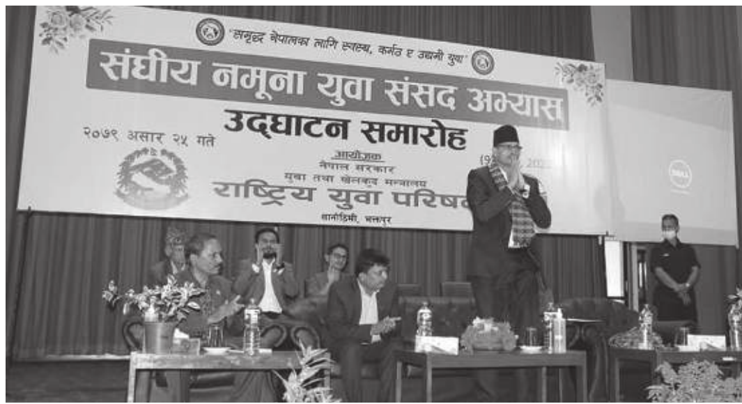
काठमाडौं/मस-प्रतिनिधिसभाका सभामुख अरुणप्रसाद सापकाटाले निर्वाचनमा हुने सबै खालका विकृति

र विसंगतिको अन्त्यका लागि अभियान नै संचालन गर्न युवाहरूलाई आग्रह गरेका छन्।