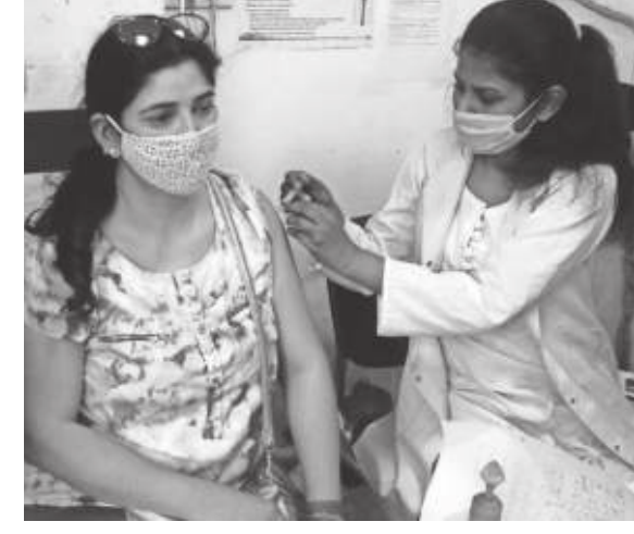
देशभरबाट कोभिडविरुद्धको खोप लगाउने गरेका उनले बताए। विहीबार दिल्लीमा ११८ नयाँ कोभिड-१९ संक्रमणका

काठमाडौं/एजेन्सी- भारतको संघीय राजधानी नयाँ दिल्लीमा कोभिडविरुद्धको खोप लगाउन योग्य जनसंख्याको सतप्रतिशत व्यक्तिलाई खोपको पहिलो मात्रा लगाइसकेको मुख्यमन्त्री अरविन्द केजरीवालले शुक्रबार बताएका छन्।