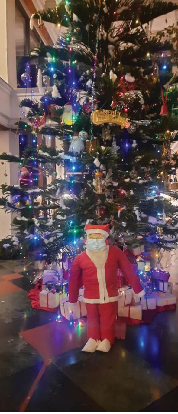
इसाई समुदायको पर्व क्रिसमस मनाउने क्रममा पोखराको एक होटलमा सजाइएको क्रिसमस ट्री र शान्ता वलज।

ई-पत्रिका अनलाइन पढ्नका लागि क्यूआर कोड स्क्रान गर्नुहोला।