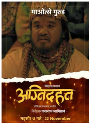
चरित्रका लागि धेरै तयारी पनि गरेको थियो। म गाउँमा जन्मेर हुँदाको मान्छे। धामी भर्ना

काठमाडौं/स- कलाकार माओत्से गुरुङ निर्देशन र अभिनयमा अब्बल छन्। दर्जनौं फिल्ममा अभिनय गरिसकेका माओत्से फिल्म 'दयारानी'का निर्देशकसमेत हुन्। यिनै माओत्से आगामी मंसिर ७ गतेबाट रिलिज हुने फिल्म 'अग्निदहन'मा धामीको चरित्रमा दर्शनकाम आउँदैछन्। माओत्सेका अनुसार उनलाई धामीको चरित्र निभाउन सजिलो थियो। 'एउटा यस्तो व्यक्ति बन्न थियो, जसले व्यक्तिलाई होइन, समाजलाई आफ्नो नियन्त्रणमा राख्यो। मैले यो