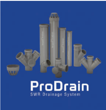
ड्रविल सकेटका साथ विभिन्न लम्बाइ तथा विभिन्न आकारमा उपलब्ध छन् ।

काठमाडौं/मस - मंगलम इन्डस्ट्रिजले प्रोड्रेन पाइपहरू बजारमा ल्याएको छ । बजारमा प्रयोगको प्रकार अनुसार छुट्टा-छुट्टै किसिमको ड्रेन पाइपहरू उपलब्ध छन् । जस्तै भूमिगत जल निकासका लागि माटोको पाइप, फोहोर निकासका लागि वेग्ले पाइप, भेन्टिलेसनको लागि भेन्ट पाइप, वर्षाको पानी संकलनको लागि ड्रानस्पाउट पाइपको प्रयोग गरिन्छ ।