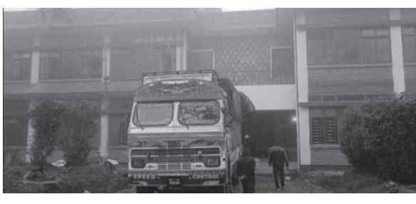
जगत ठाडा मार/मध्याह्न नवबपरासी, २० मंसिर

महिना भित्रै सानै तयारी छ। प देश राजधानी सानै लागेकोमा रूपन्देहीका प्रमुख दलले भने असहमति राख्दै आएका छन्। यसअघि नेपाली कांग्रेस रूपन्देहीले मुख्यमन्त्री कार्यालय पुगेर स्थायी पूर्वाधार नबनेको अवस्थामा तत्काल मन्त्रालय नसान आग्रह गर्दै ज्ञापनपत्र बुझाएको थियो।