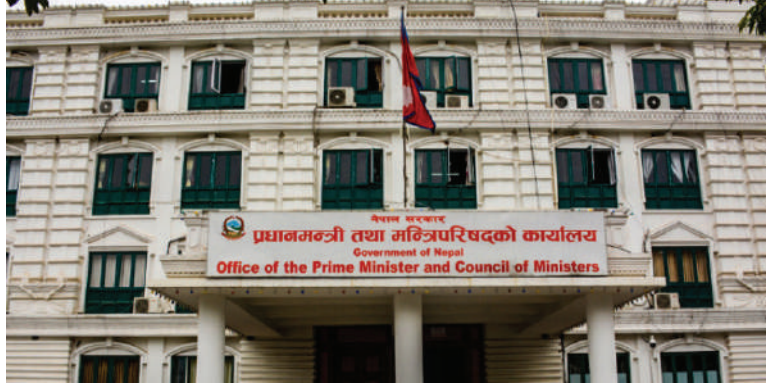
नारायण अर्याल/मध्यान्ह काठमाडौं, २० मंसिर ।

सरकारले आयातमा लगाएको प्रतिबन्ध हटाउने भएको छ । मंगलबार वसेको मन्त्रिपरिषद् बैठकले आगामी २९ मंसिरदेखि लागु हुनेगरी प्रतिबन्ध हटाउने निर्णय गरेको हो ।