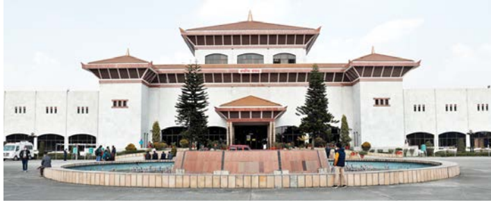
प्रहीसम्बन्धी दुईवटा र अर्थ सम्बन्धी विधेयक संसदमा दर्ता गराउने तयारी केही विधेयकहरू गरी १९/१२ वटा गरेको हो।