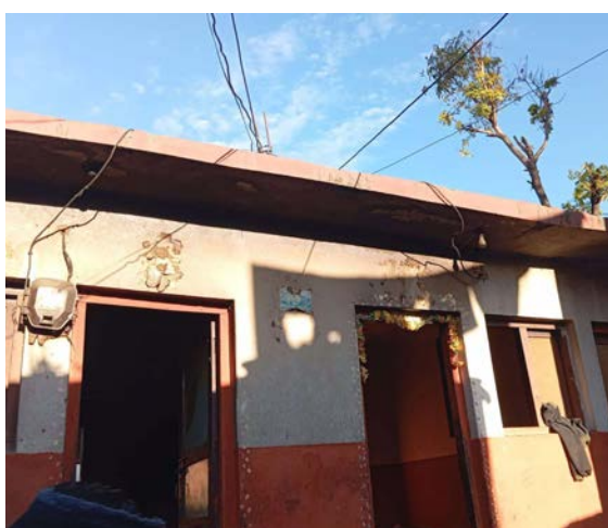
भएको बताइन्। उनका अनुसार, प्रति परिवार २ हजारदेखि ४ हजारसम्मको बिल पुगेको छ, जुन खानेपानी उपभोक्ता समितिका

सत्यराज सिंह/मध्याह्न बम्हाङ, २१ पुस बम्हाङ सदरमुकाम चैनपुर स्थित वादी समुदायका करिब १० घरपरिवार पाँच महिनादेखि खानेपानी र विद्युत् अभावमा बसिरहेका छन्। पानी र बत्तीको महसुल तिन नसक्दा उनीहरूको जीवन अन्धकारमय बनेको छ। हरिना वादीका अनुसार, ५-६ महिनादेखि खानेपानीको अभावले सेती नदीबाट पानी ल्याउन बाध्य भएका छन्। स्थानीय बम्म वादी भन्छन्, 'पानी र बत्ती नहुँदा बच्चैको कष्टकर बनेको छ।' राधा वादीले विजुलीको लाइन काटिएपछि बालबालिका, वृद्ध-वृद्धा सबैजना अघ्यारोमा बस्न बाध्य