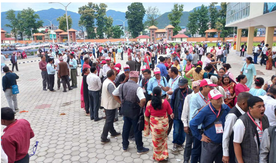
नेकपा एमाले लुम्बिनी प्रदेशको मंगलबार सम्पन्न प्रथम अधिवेशनमा प्रतिनिधिहरू ।

केपी शर्मा ओलीले आफू नेतृत्वको नेकपा एमालेमा कुनै गुटबन्दी नरहेको सार्वजनिक अभिव्यक्ति दिने गरेका छन् । तर लुम्बिनी प्रदेशको अधिवेशनले एमालेभित्र दुईधारा संघर्ष कार्यकर्तासम्मै पुगेको प्रष्ट भयो ।