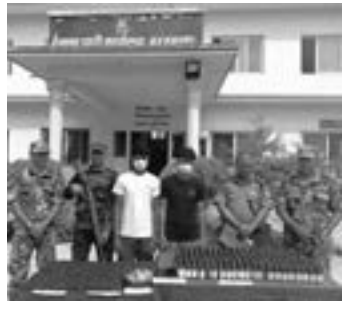
प्रहरी बल नेपाल सुरक्षा वेस सुन्दरपुर

शुकुवार राति सर्लाहीको मधुवनीबाट काठमाडौंका लागि छुट्टेको वा.प्र.०५-००१ ख ०००३ नम्बरको यात्रुवाहक बसलाई इलाका प्रहरी कार्यालय बरहथवा र सशस्त्र