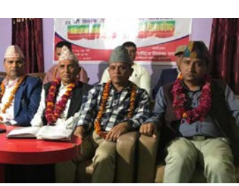
शोभाकर पन्थी/मध्यान्ह अर्घाखाँची, ३० चैत

नेपाल राष्ट्रिय शिक्षक संगठन अर्घाखाँचीले विभिन्न कार्यक्रम आयोजना गरी ४५ औं शिक्षक दिवस मनाएको छ। संगठनले शिक्षक दिवसको रस्थापना भएपछि पनि आफूलाई असुरक्षित महसूस गर्नु दुःखद कुरा भएको भन्दै उनले नेकपा एमाले शिक्षकका समस्याप्रति गम्भीर र चिन्तित रहेको बताए। संघीय शिक्षा ऐन शिक्षकमैत्री ल्याउनका निम्ति आफ्नो पार्टीले पहल गर्ने उनको भनाइ थियो।