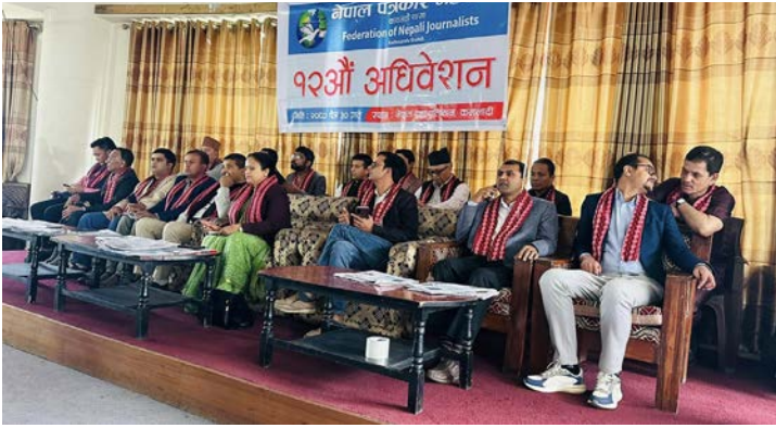
समिति (रासस)को समाचार शुल्कमा सहूलियत उपलब्ध गराउन सकिने धारणा राखिन्।