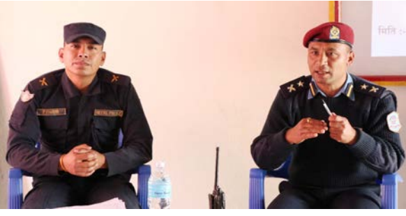
निस्ता कार्की/मध्यान्ह कालीकोट, ३० चैत

कालीकोटमा आगलागीका घटना बढ्न थालेको छ। गत असार यता आगलागीका २० घटना भएको र यी घटनामा परेर तीन जनाको मृत्यु भएको छ। जिल्ला प्रहरी कार्यालय कालीकोटले नयाँ वर्ष २०८० को समापन र २०८१ को स्वागतका लागि आयोजना गरेको शुभकामना आदान-प्रदान कार्यक्रममा सो जानकारी गराएको हो।