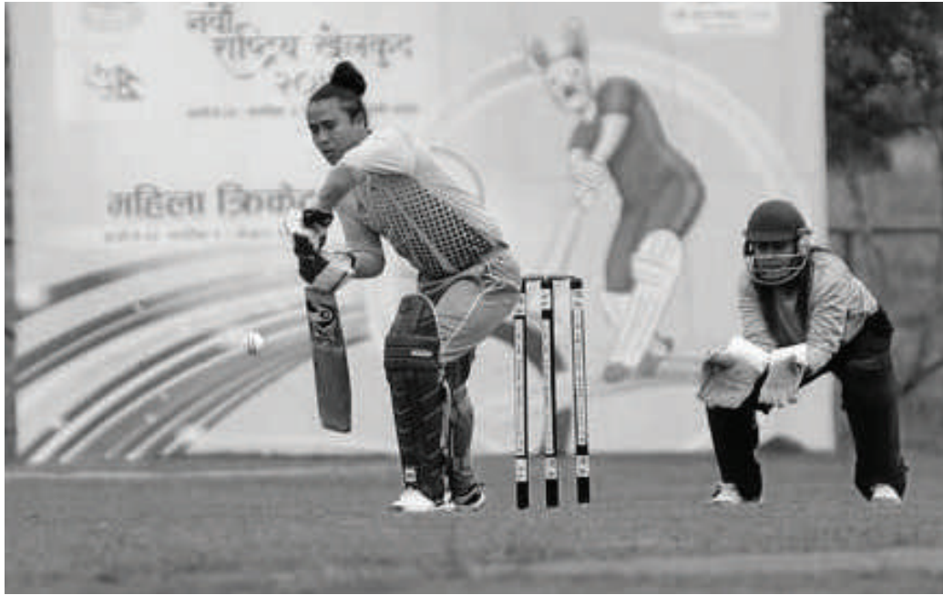
मध्याह्न संवाददाता काठमाडौं, २५ असोज