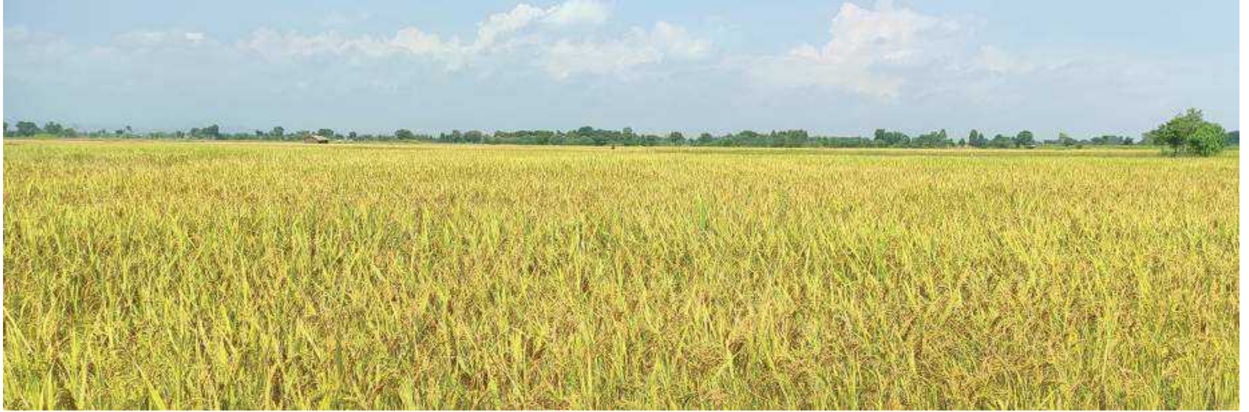
सप्तरीको हनुमान नगर कंकालिनी नगरपालिका-१ वेशी पलारमा पाकदै गरेको धानबाली । यो वर्ष धान उत्पादन बढ्ने अनुमान गरिएको छ ।