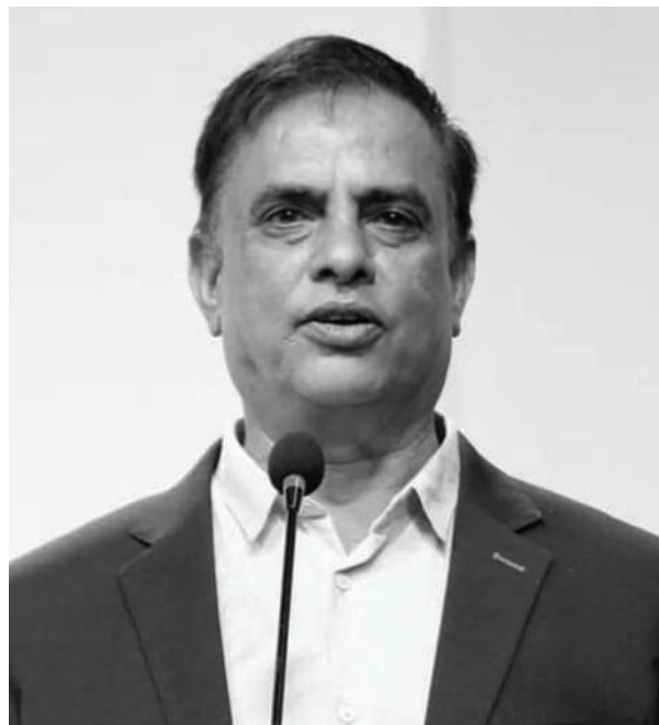
नातागोता, साथीभाईलाई प्रचार-प्रसारको आशा नगर्न आग्रह गरेका हुन् । नाता र आत्मिय सम्बन्ध गाँसिएका व्यक्तिहरू

काठमाडौं/मस- बरिष्ठ कलाकार हरिवंश आचार्यले निर्वाचनमा कुनैपनि उम्मेदवारले आफूहरूमार्फत चुनावी प्रचार र भोट माग्दिने आशा नगर्न अनुरोध गरेका छन् । आगामी मंसिर ४ गते हुन लागेको प्रतिनिधि र प्रदेश सभाको निर्वाचनका लागि उम्मेदवारी दर्ता गरेसँगै विभिन्न पार्टीका उम्मेदवारले घरदैलो र सामाजिक सञ्जालबाट प्रचार-प्रसार थालिसकेका छन् । चुनावको बेला भोट र भीड बटुल्न कलाकारलाई प्रयोग गर्ने चलन छ । नातेदार उम्मेदवारको रूपमा छडा भए कुनै पार्टीमा आवद्ध नभएका कलाकारहरूलाई पनि प्रचार गर्नुपर्ने दबाव हुन्छ ।