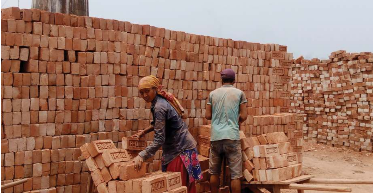
अन्तरराष्ट्रिय श्रमिक दिवसको दिन आइतबार कर्णालीको काला गाउँपालिका-१ सोलुखुम्बुको एक ईटाभट्टा उद्योगमा काला गाउँ श्रमिक ।

आयोगका प्रवक्ता शालिग्राम - बाँकी पृष्ठ २ मा