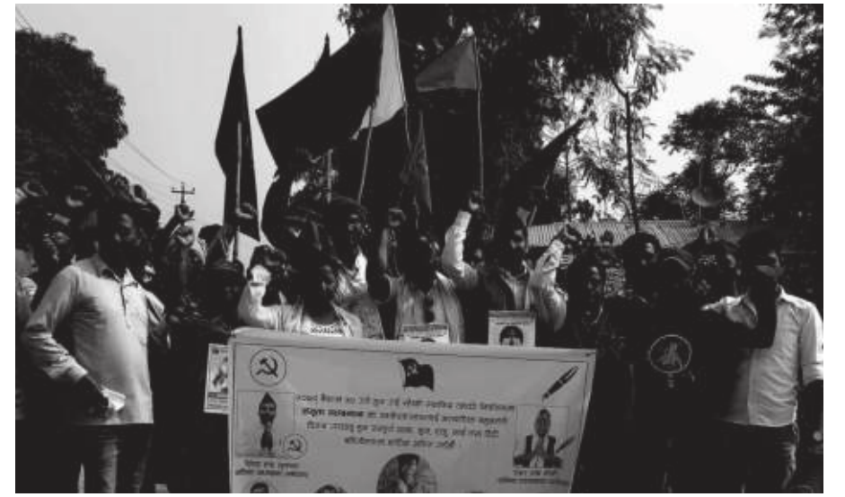
गणेश रावत/मध्याह्न कोहलपुर, १८ वैशाख

निर्वाचन नजिकैएसंगै बाँकेका राजनीतिक दलहरू घरदैलो अभियानमा व्यस्त भएका छन्। निर्वाचन आउन १२ दिन मात्र बाँकी रहेका यतिबेला देश स्थानीय तहको निर्वाचनमा हुँदै गएको छ। निर्वाचन नजिकै गर्दा बाँकेका राजनीतिक दलहरू गाउँ पस्न थालेका छन्। गाउँ, टोल, सहर, बजार गल्लीगल्लीमा निर्वाचनको चर्चा निकै बढेको छ। ठूलो दलको रूपमा रहेका नेपाली कांग्रेस, नेकपा