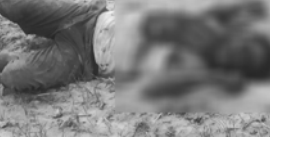
शव फेला परेको स्थानभन्दा केही अगाडि सिजे ०१ एजे २५६८ नम्बरको भारतीय मोटरसाइकल पनि फेला परेको थियो।

घटनाको प्रकृति हेर्दा ती पशुको घाँटीले हतियारले घाँटी रेटेर हत्या गरिएको प्रहरीको प्रारम्भिक अनुमान रहेको जिल्ला प्रहरी कार्यालय रौतहटकी प्रवक्ता