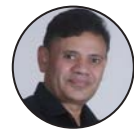
- गुमाराम सनाल

रास्वपालाई साँच्चकै मन्त्रालय र संसद्मा देशको जर्सी नै लाएर उपस्थित हुने क्रिकेट मोह थियो भने १०० दिन सरकार र हातमा खेलकुद मन्त्रालय हुँदा कमसेकम टिप्टु क्रिकेट मैदानमा फलडलाइट लगाई सक्थ्यो होला। आखिर प्रमले लाइट लगाउन घोषणा गरेको वर्षै बितिसकेको थियो, जर्सी जस्तै लाउन सकिन्थ्यो!