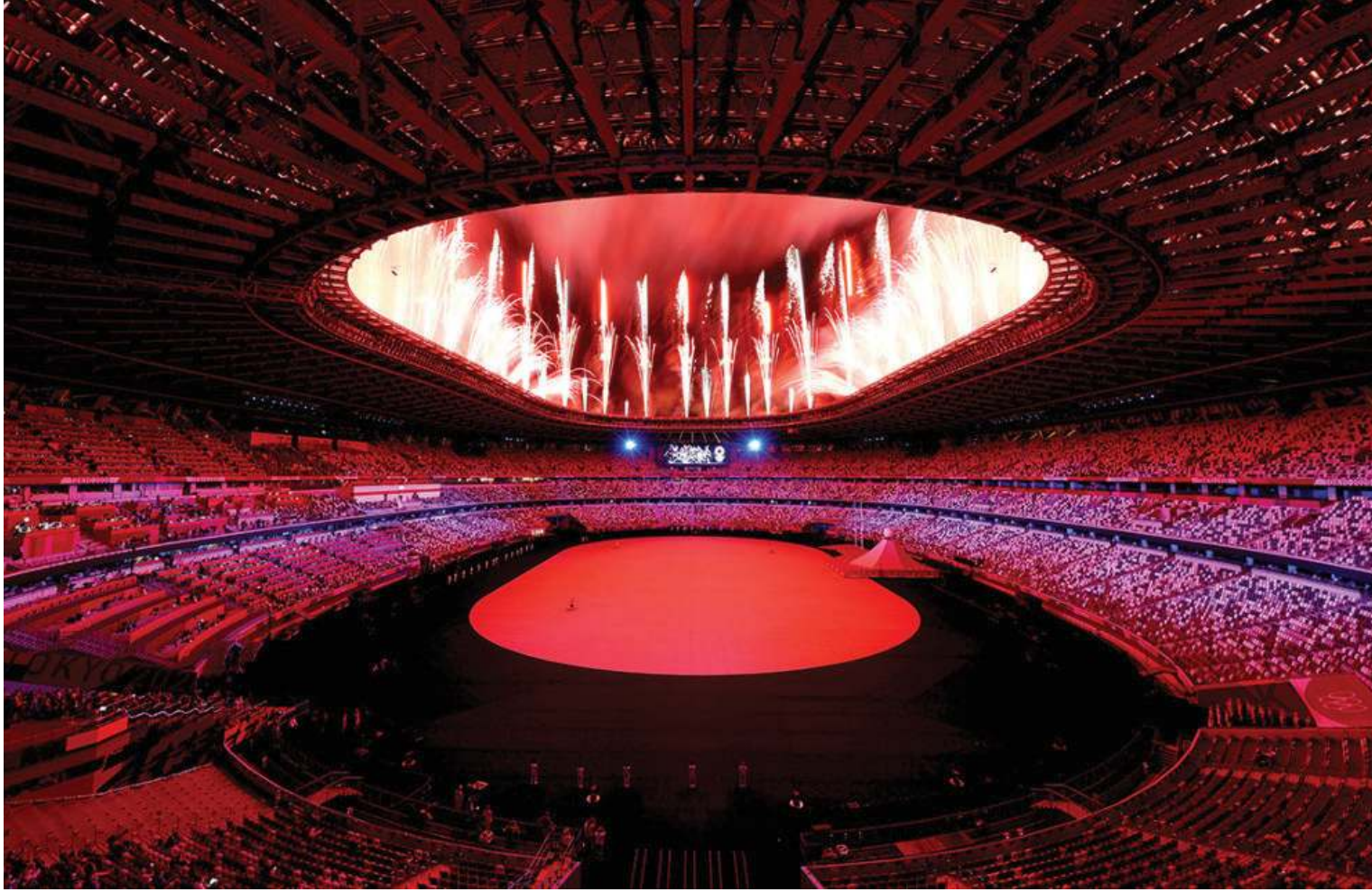
महाकुर्वमको उद्घाटन: विश्व खेलकुद महाकुर्वम भनेर चर्चित ओलम्पिक जेक्सको ३२औं संस्करण टोकियोस्थित ओलम्पिक रंगशाला उद्घाटन भएको छ । नेपाली समयाञ्जुसार साँझ ८:४५ बजे ओलम्पिक उद्घाटन भएको छ ।