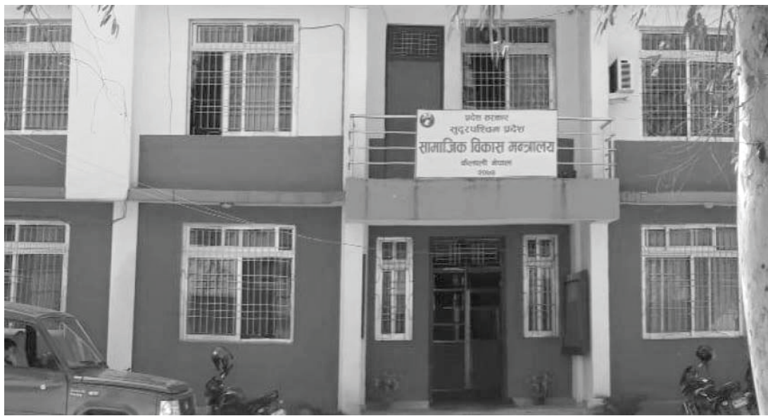
हिमेश विक/मध्याह्न धनगढी, ८ साउन

गत वैशाखमा कोभिड-१९ को संक्रमण बढेसँगै सरकारी अस्पताल संक्रमितले भरिएपछि प्रदेश सरकारले निजी अस्पतालहरूले पनि कोभिड संक्रमितको उपचार गर्ने निर्णय गर्‍यो। सुदूरपश्चिम प्रदेशमा पनि प्रदेशको सामाजिक विकास मन्त्रालयले कैलाली र कञ्चनपुरका ११ वटा निजी अस्पतालसँग कोभिड संक्रमितको उपचार गर्नुपर्ने र त्यसको खर्च सरकारले भुक्तानी गर्ने सम्झौता गरेको थियो।