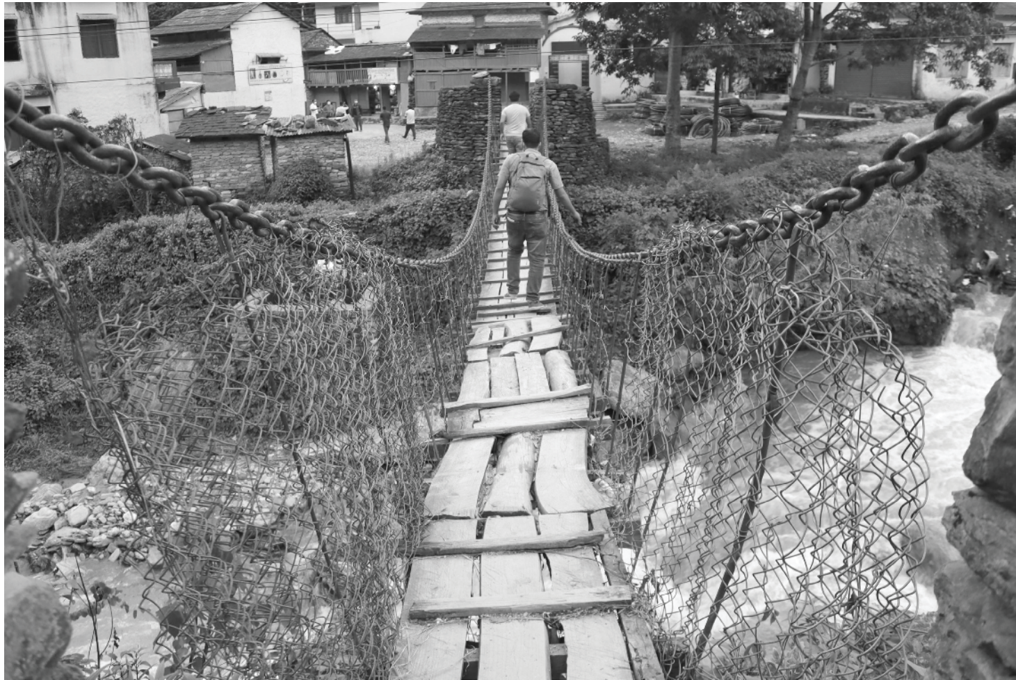
बागलुङको गलकोट नगरपालिका-२, नरेटौटीस्थित गौदी खोलामाथिको जीर्ण अवस्थामा रहेको भोलुङ्गो पुल।