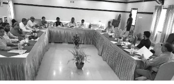
पवन जयसवाल/मध्याह्न नेपालगञ्ज, ८ साउन

वाकैको नेपालगञ्ज मेडिकल कलेज शिक्षण अस्पतालमा केही दिन देखि आन्दोलनरत कर्मचारी र अस्पतालको प्रशासनबीच शुकवार आपसी सहमति भएको छ। एक हप्ता देखि अस्पतालका स्वास्थ्यकर्मी र कर्मचारीहरू आन्दोलनमा रहेका थिए। आन्दोलनरत