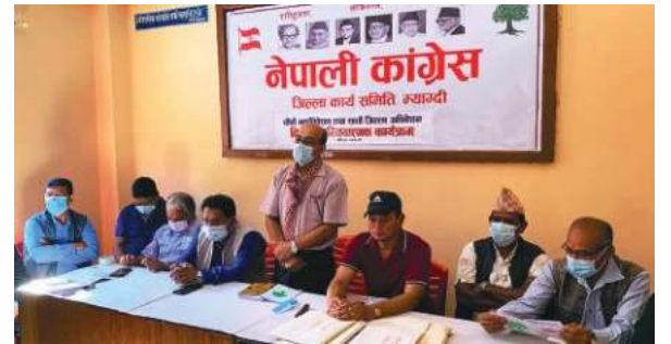
नेपाली काँग्रेस म्याग्दीले वडा अधिवेशनको तयारीका लागि बेनीमा आयोजना गरेको बैठक ।

नेपाली कांग्रेस चुनावी सरगमी बढेको छ । भोलि कांग्रेसको वडा अधिवेशन हुँदैछ । वडा अधिवेशनका लागि नेताहरू गाउँगाउँ पुगेका छन् । भोलिबाट शुरू हुने महाधिवेशन मंसिरसम्म चल्नेछ । वडा, स्थानीय तह, प्रदेशसभा निर्वाचन क्षेत्र, प्रतिनिधिसभा निर्वाचन क्षेत्र, जिल्ला, प्रदेश हुँदै मंसिर ९-१३ मा महाधिवेशन हुनेछ ।