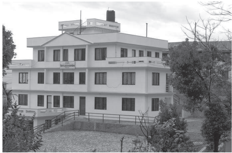
देखाएका सबैजना होम आइसोलेशनमा रहेका छन्।