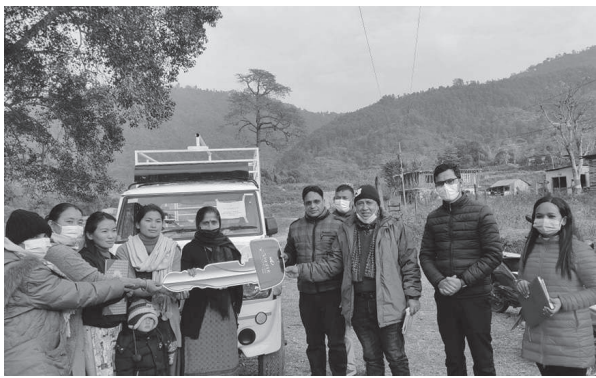
रामपुर (पाल्पा), ११ माघ