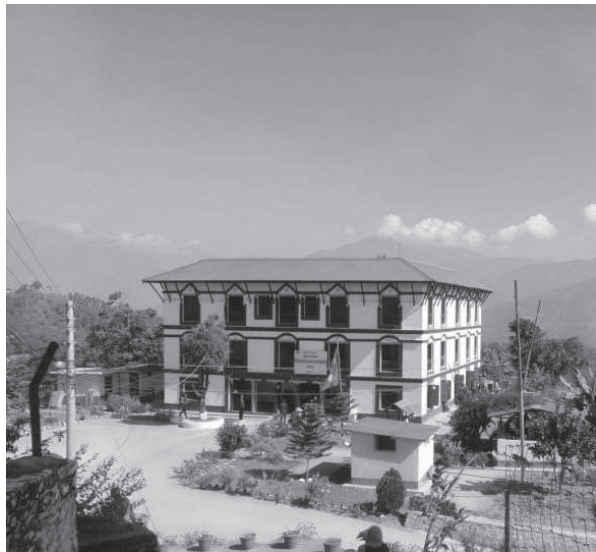
यामराज विष्ट/मध्याह्न दैलेख, ११ माघ

जिल्ला प्रशासन कार्यालय दैलेखले कार्यालयमा आउने सेवाग्राहीलाई कोरोनाविरुद्धको खोप दिएको छ। प्रशासनका अनुसार माघ ११ गतेसम्म सञ्चालन हुने खोप अभियानमा हालसम्म इलाका प्रशासन कार्यालय दुल्लुमा १७५ जना र जिल्ला प्रशासन कार्यालय दैलेखमा १७ सय ७१ जनाले कोरोनाविरुद्धका खोप लगाएका छन्।