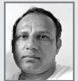
प्रदीप के रिमाल

१. आँटा पिठोलाई तोडफोड गरेर केक बनाइन्छ, यहाँ पैसा नै नभएको बैंक खाताको चेक बनाइन्छ, यहाँ राष्ट्रमा चौतर्फी भ्रष्टाचार भयो भन्ने आवाज उठाउँदा, देशभक्त, कर्मठ, सपूत छोरोलाई फेक बनाइन्छ, यहाँ ॥