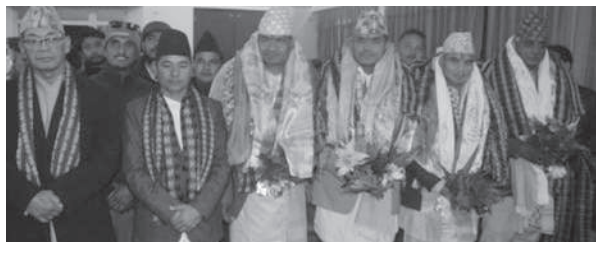
कर्णाली ब्यूरो/मध्याह्न सुबिन, ११ माघ