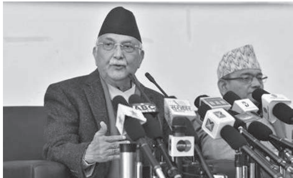
काठमाडौं, ११ माघ

नेकपा एमालेका अध्यक्ष केपी शर्मा ओलीले कांग्रेसले आफू सरकारमा जानुलाई विकास र लोकतन्त्र भन्ने गरेको टिप्पणी गरेका छन्।