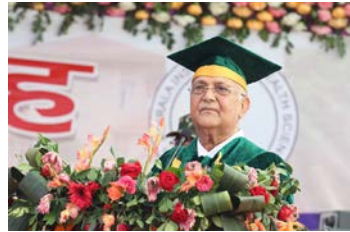
सफलता प्राप्त हुने भएकोले उत्पादित नयाँ चिकित्सकहरूलाई बक्स सिकलसेलको

काठमाडौं/मस-प्रधानमन्त्री केपी शर्मा ओलीले छिमेकी भारतमा उत्पादन र परीक्षण भएको सिकलसेलको औषधि ल्याएर नेपालका विरामीलाई वितरण गर्ने बताएका छन्। नेपालको धारु समुदायमा यो रोग बढी लाग्ने गरेको छ। बीपी कोइराला स्वास्थ्य विज्ञान प्रतिष्ठान, धरानको १३ औं दीक्षान्त समारोहमा प्रधानमन्त्री ओलीले संसारमा खोज र अनुसन्धानबाट पत्ता नलाग्ने र इमानदार तथा लगनशील भएर काम गरेमा