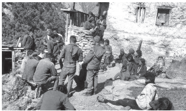
ओवराज शाही/मध्यान्ह हुम्ला, ५ फागुन

हुम्लाको दक्षिणी क्षेत्रको ताँजाकोट गाउँपालिका-३ को मासपुर गाउँका स्थानीय पच्चीस वर्षदेखि लालपुर्जाविहीन बनेका छन्। २०५४ सालमा जग्गाको नापी भए पनि यहाँका स्थानीयले हालसम्म जग्गाको लालपुर्जा पाएका छैनन्।