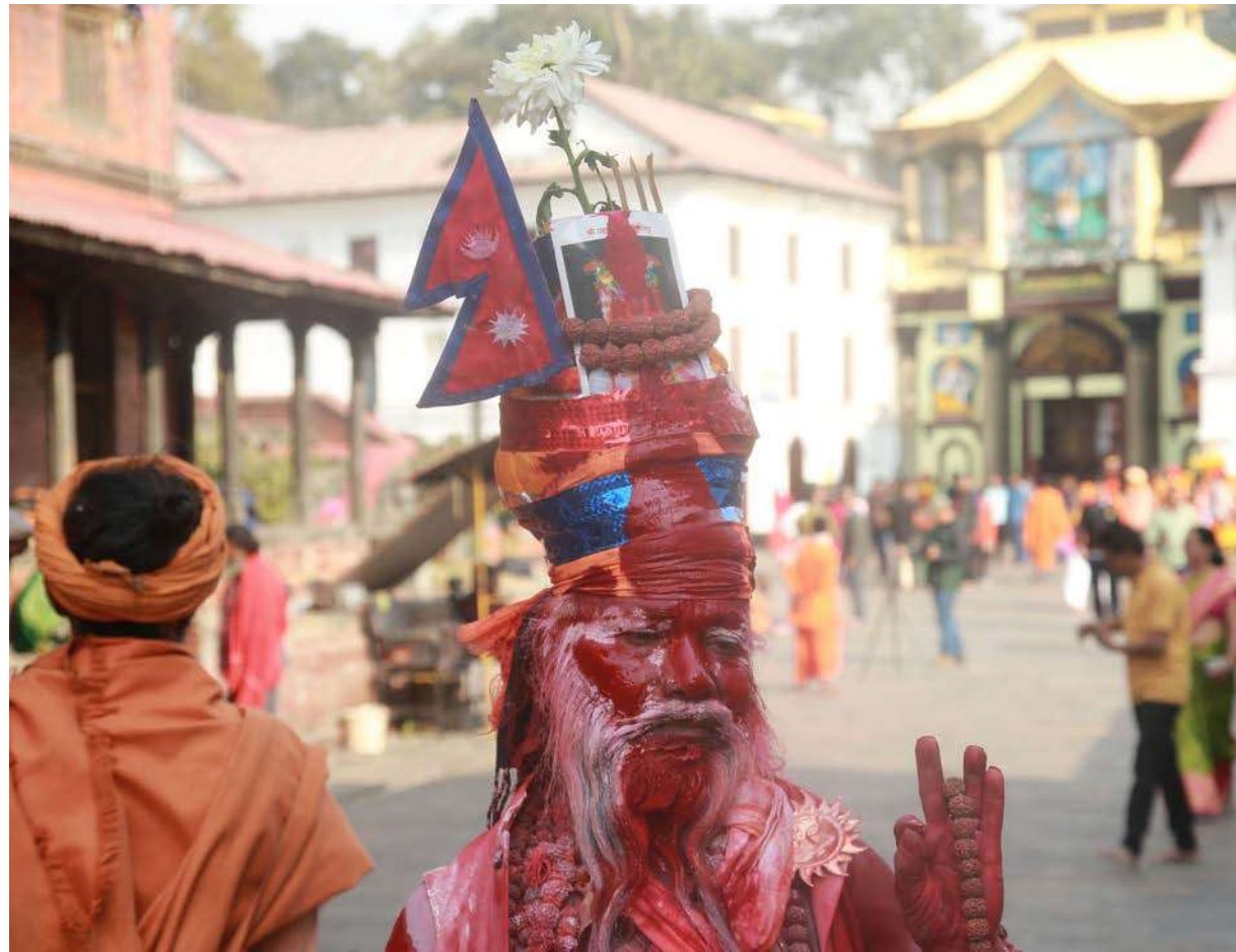
महाशिवरात्रिको पूर्व सन्ध्यामा काठमाडौंस्थित पशुपतिनाथ मन्दिर परिसरमा शुकुबार भक्तजन तथा साधुहरु ।