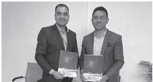
काठमाडौं/स - आइएमई पे नेपाल क्लियरिङ हाउस मार्फत

प्रबन्धित नेशनल पेमेन्ट स्विचमा आबद्ध हुने भएको छ। विद्युतीय भुक्तानी प्रणालीलाई फने व्यापक र सुरक्षित बनाउने उद्देश्यका साथ सो सम्बन्धि सम्झौता सम्पन्न भएको हो।