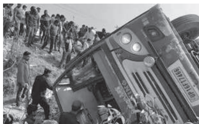
जगत ठाडा मगर/मध्यान्ह परासी, ७ माघ

नवलपरासीमा भारतीय तीर्थालु सवार बस दुर्घटना भएको छ । दुर्घटनामा चालकसहित ४५ जना घाइते भएका छन् । जिल्ला प्रहरी कार्यालयका अनुसार शनिवार विहान करिव साढे ११ बजे पाल्पानन्दन गाउँपालिका १ फर्दरहोला नाँजकै रमपुरवास्थित भित्रि सडक खण्डमा बस दुर्घटना भएको हो ।