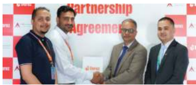
हजार रुपैयाँसम्मको छुट र क्रेडिट कार्ड मार्फत अग्रिम भुक्तानीमा अधिकतम २० प्रतिशत वा

काठमाडौं/मस - नविल बैंक र दराजबीच 'दराज दशैं धमाका' महोत्सवका लागि सम्झौता भएको छ। सम्झौता अन्तर्गत भदौ २९ गतेबाट दराजबाट किनमेल गर्दा नविल कार्डवाहकहरूले आकर्षक छुटको पाउने छन्। दराज दशैं धमाकाको अवधिमा अनलाइन सामान खरिद गर्दा नविलको डेबिट कार्ड मार्फत अग्रिम भुक्तानीमा अधिकतम १५ प्रतिशत वा २