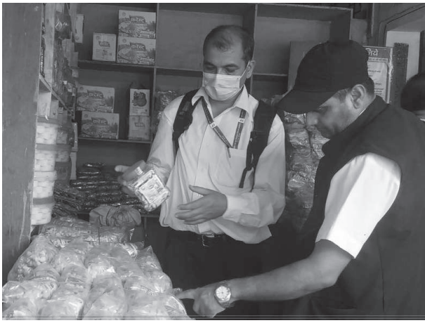
कम्पनीमा छ्यापछ्याप्ती ग्यास

उनले बजारमा खाद्यान्न लगायत उपभोग्य बस्तुहरूको कालोबजार हुन नदिन मञ्चले बेला-बेला छड्के अनुगमन पनि गर्ने गरेको जानकारी गराए।