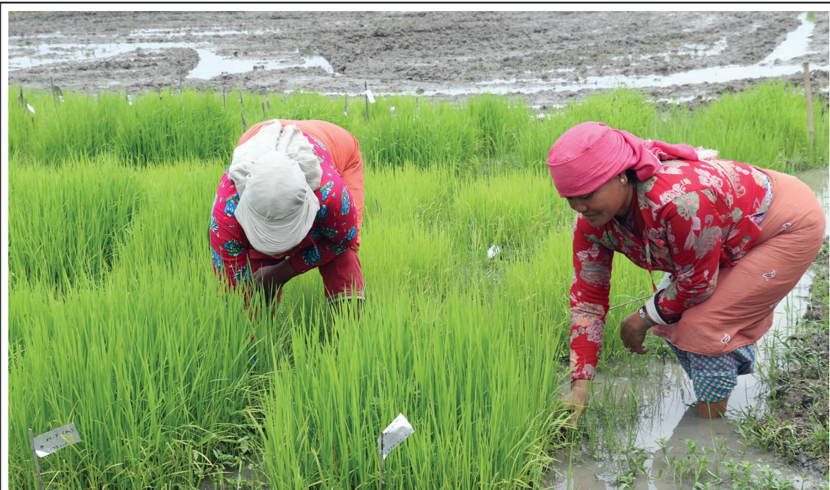
नेपाल कृषि अनुसन्धान परिषद् बाली विज्ञान महाशाखा खुमलटारमा सोमबार रोपाईं गरी सत्रौँ राष्ट्रिय धान दिवस मनाइयो । फार्म परिसरमा रोपाईंका लागि राखिएको धानको बीउ ।