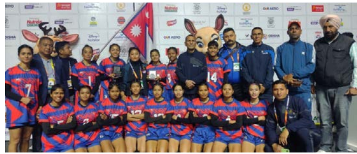
युगाण्डासँग खेलेर नेपाली महिला टिमले अब फाइनल प्रवेशका लागि काठमाडौंको विजयी सुरुवात

काठमाडौं मस- भारतमा जारी खो खो विश्वकपअन्तर्गत नेपालको महिला तथा पुरुष दुवै टिम सेमिफाइनलमा प्रवेश गरेका छन्। शुक्रबार भएको क्वाटरफाइनलमा इरानलाई हराउँदै महिला टिम सेमिफाइनलमा पुगेको हो भने बंगलादेशलाई हराउँदै पुरुष टिम सेमिफाइनलमा पुगेको हो।